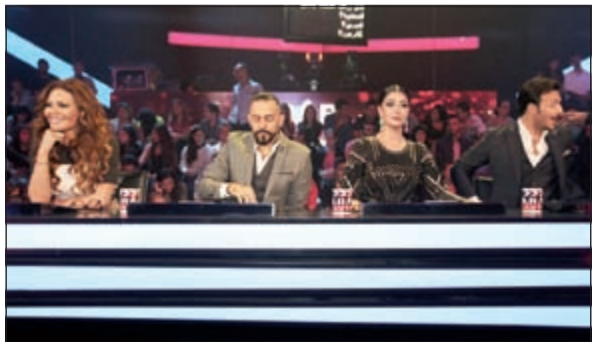
غادة مع أعضاء لجنة التحكيم

الموضوع؟، لا تسمح الله ان كنت ساذهب الى عزاء فسارتي العباة واحترم ذلك السري واعطي الوقت والمكان حقه، وان كانت لدي جلسة تصوير لاحد المصممين فسارتي ما يليق في هذا الموضوع، وانذا نهدت الى الجم (النادي الصحي)، فسارتي التريينغ، ولكل مناسبة اعطيها وضعها واحترم من خلاله، فأذا كانت الصورة التي عرضتها على حسابي الخاص بالانستغرام في لباس البحر اثارت البعض فكل وقت ملابس خاصة وانا اعطي لكل مكان حقه، وانا لم اعرض صورة كاملة، ولو كنت ارتدي فستان سهرة فسيكون له ديزاي خاص به وقد يكشف أكثر من الصورة التي عرضتها وهي من حياتي الخاصة، ولن أؤدي احداً بها ابد، فلم اللغوة والاقاويل حول هذا