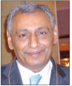
السفير خالد الدويسان