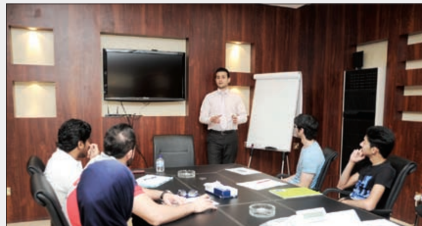
صورة أرشيفية لعدد من متدربي «لويك» في «الأنباء»