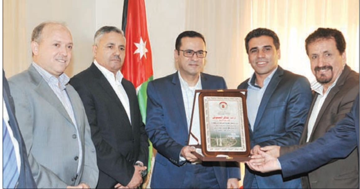
تكرم من الجالية الأردنية نائب السفير الوزير المفوض شاكر العموش

أقامت السفارة الأردنية حفل تكريم للجهات الراعية لليوم الرياضي الذي نظمته السفارة الأسبوع الماضي ممثلة بعدد من المؤسسات، والذي يأتي في إطار الأنشطة المختلفة التي تنظمها السفارة الأردنية للجالية، وبهذه المناسبة قال نائب السفير الوزير المفوض شاكر العموش: إن التكريم يأتي في إطار قيام الجالية بنشاط رياضي لأبناء الجالية الأسبوع الماضي.