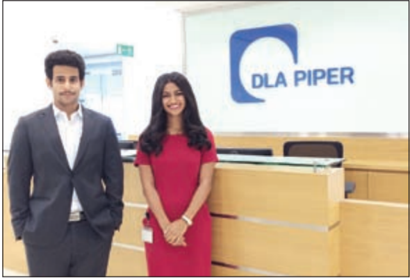
مشاركين في برنامج «دي إل إيه بيبر» في دبي

المادي من قبل مجموعة الكوت الغذائية لما استطاعت التوسع في برامجها خارج الكويت، موضحة أن علاقة لويك بمجموعة الكوت الغذائية هي علاقة وثيقة ومتجددة، إذ أن المجموعة تتحمل مسؤولية كبيرة لتطوير الفئة الشابة، وقادة المستقبل من خلال دعمها وشراكتها لمبادرات المؤسسات غير الربحية، فتؤمن لهم الدعم غير المحدود كما وفرته لويك لتضمن لهم المستقبل الواعد.