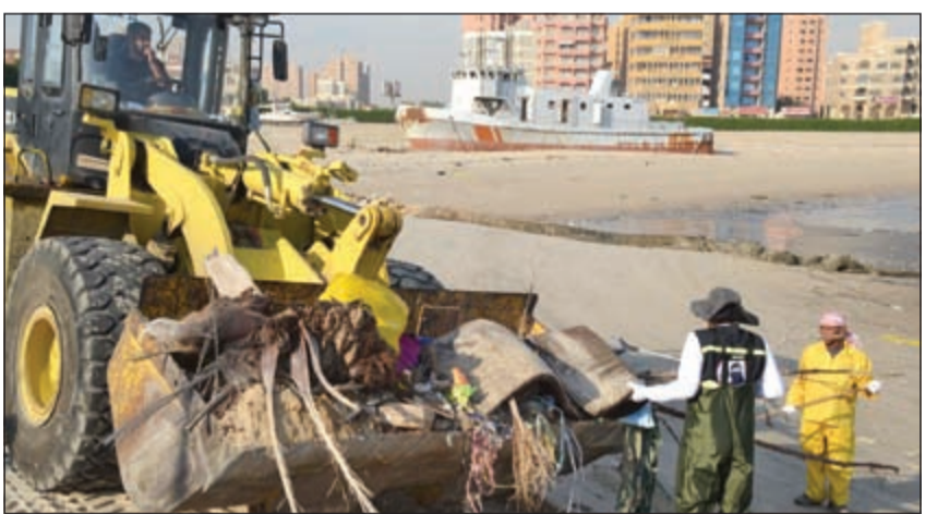
جانب من نشاط فريق الغوص في رفع المخلفات الضارة

على قذفاها في الساحل إضافة إلى مخلفات أخرى تواجدت بسبب التيارات المائية والأمواج، مؤكداً أن الساحل يعاني تلوّناً مؤكداً نتيجة هذه المخلفات إضافة إلى وجود السفن الحديدية الغارقة في الموقع.