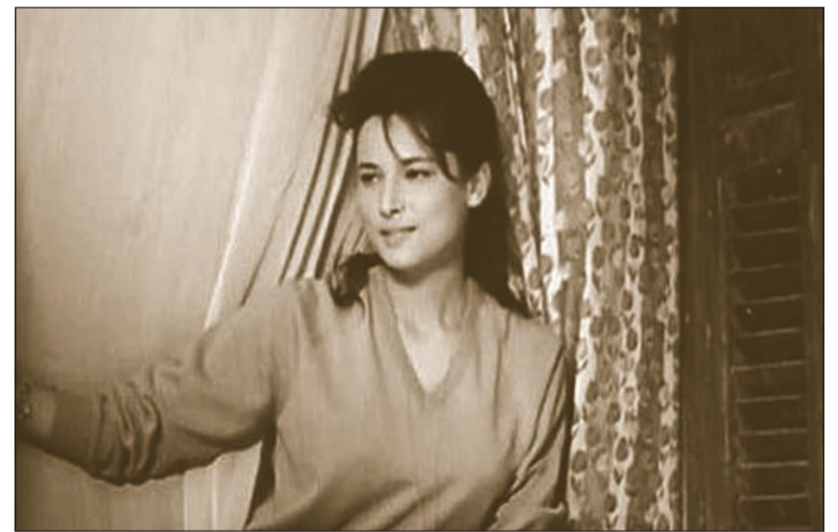
الراحلة مديحة سالم

غيب الموت الفنانة مديحة سالم بعد صراع طويل مع المرض، وذلك عصر الخميس، حيث توفيت داخل أحد المستشفيات بالقاهرة عن عمر يناهز الـ 71 عاما. وكانت الحالة الصحية للفنانة الراحلة قد تدهورت في الفترة الأخيرة، لكنها كانت ترفض الدخول إلى المستشفى وتصر على التواجد بمنزلها، قبل ان يتم نقلها إلى المستشفى لغرفة العناية المركزة بعدما صارت الحالة حرجية، خاصة أنها كانت تعاني من مشاكل في الجهاز التنفسي. وحرص عدد من الفنانين على زيارة الراحلة في أيامها الأخيرة، حيث كانت تتواجد إلى جوارها الفنانة رجاء الجداوي وميرفت أمين ودلال عبدالعزيز، كما كان نقيب الممثلين أشرف زكي يحرص على زيارتها والاطمئنان إلى حالتها الصحية.