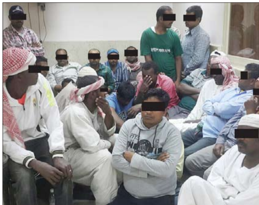
المخالفون الذين تم ضبطهم بالأحمدي

احال رجال أمن العاصمة بتعليمات من اللواء ابراهيم الطراح امرأة خليجية تم ضبطها في نقطة تفتيش بمنطقة شرق وتبين انها مطلوبة للتنفيذ بمبلغ 500 دينار وأحيلت الى جهة الاختصاص. كذلك ضبط رجال أمن العاصمة خلال نقطة