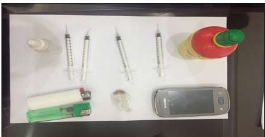
الابر التي تستخدم في التعاطي وبعض المضيوبات