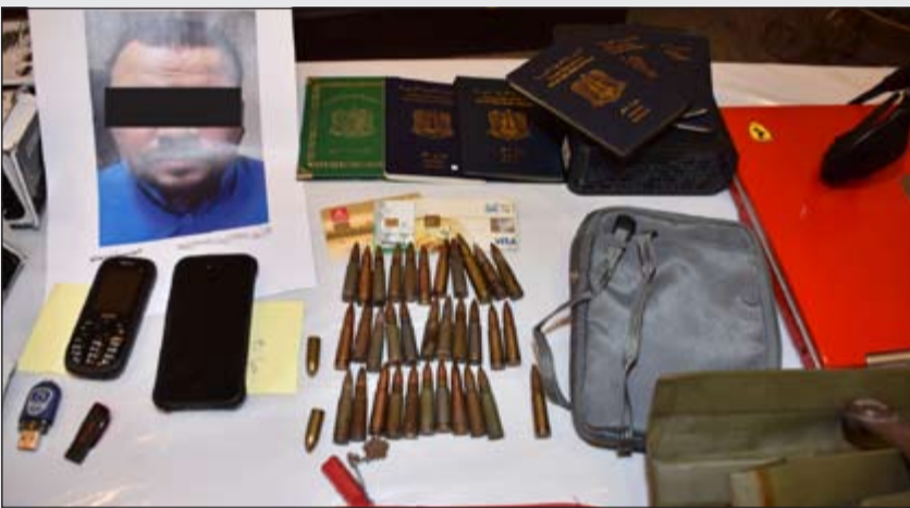
جانب من المضيوبات خلال توقيف الخلية الداعشية وصورة أحد أعضائها

وقال الخالد لرجال أمن الدولة إن ثقة القيادة السياسية العليا فيكم دافع وحافز لنا مزيد من الجهد والعبء والإخلاص لأمن الوطن وأمان مواطنيه لما تقدمونه من إنجازات وطنية متلاحقة وعلى أعلى المستويات لقدرتكم وسرعتكم في التعامل مع الخلايا والشبكات والعناصر الإرهابية. وأضاف: كنت معكم وبيدكم أتابع تفاصيل مراحل خيوط كشف وضبط عناصر الشبكة الإرهابية الأخيرة، كما حرصت على التواجد مع رجال التحقيق والاستماع إلى سير التحقيقات مع أفراد الشبكة الإرهابية وهي تدلي بأعترافاتها عن مخططاتها الإجرامية وارتباطها مع جماعات داعش الإرهابية. واختتم الخالد اللقاء متمنياً لهم المزيد من النجاحات والتوفيق خدمة للمصالح العليا لأمن الوطن وسلامة المواطنين، وتوجيه المزيد من الضربات الاستباقية لتأمين وحماية الجبهة الداخلية وقابضة أمن الوطن من جميع الأعمال الإرهابية المشبوهة.