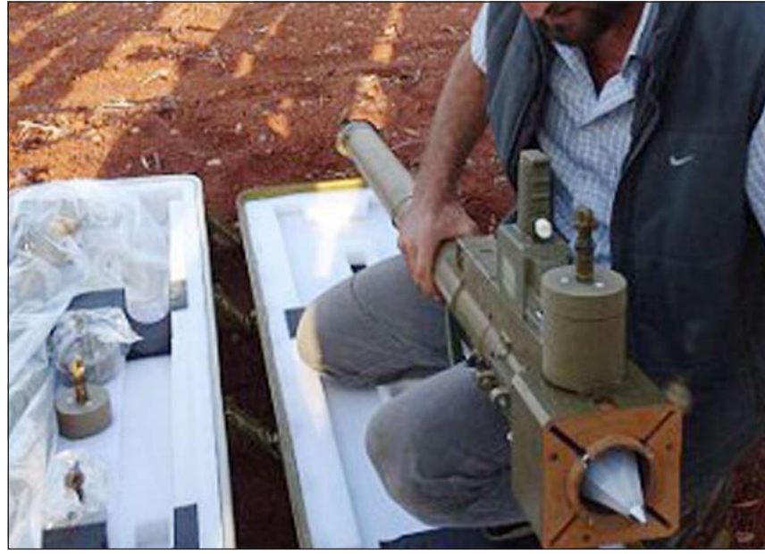
قاذف اكتشف بين المضيوبات مع التشكيل الإرهابي

قام نائب رئيس مجلس الوزراء ووزير الداخلية الشيخ محمد الخالد بزيارة مقر الإدارة العامة لجهاز أمن الدولة حيث كان في استقباله وكيل وزارة الداخلية المساعد سليمان القهد ووكيل وزارة الداخلية المساعد لشؤون أمن الدولة الداخلي اللواء عصام النهام ووكيل القابات الأمنية لأمن الدولة وقد نقل لهم تحيات وتقدير صاحب السمو الأمير الشيخ صباح الأحمد، وسمو ولي العهد الشيخ نواف الأحمد، وسمو رئيس مجلس الوزراء الشيخ جابر المبارك وفخر واعتزاز جميع المواطنين الذين تابعوا الجهود الأمنية المتميزة والتي أسفرت عن ضبط الخلية الإرهابية الأخيرة والجهود الاستباقية التي يقوم بها رجال أمن الدولة في تأمين الأمن الداخلي للوطن الغالي الكويت. واستمع الخالد من اللواء النهام إلى تقرير عن آخر مستجدات عمليات البحث والتحرير والتحقيقات الجارية مع الشبكة الإرهابية التي تم ضبطها مؤخراً.