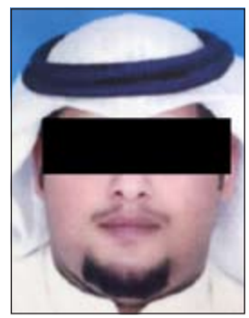
المواطن المتهم الذي تم ضبطه

وأشار المصدر الى ان ضبط الخلية كشف لأجهزة وزارة الداخلية وكذلك للأجهزة المصرفية عن خلل سوف يتم تداركه خلال الفترة المقبلة، وهذا الخلل يتمثل في تمكن متعاطفين مع المنظمات الإرهابية والمتشددة من ارسال اموال لخارج البلاد رغم الإجراءات المصرفية التي يتم اتباعها لمنع ارسال اموال بصورة غير قانونية إلى خارج البلاد. ولفت المصدر الى انه