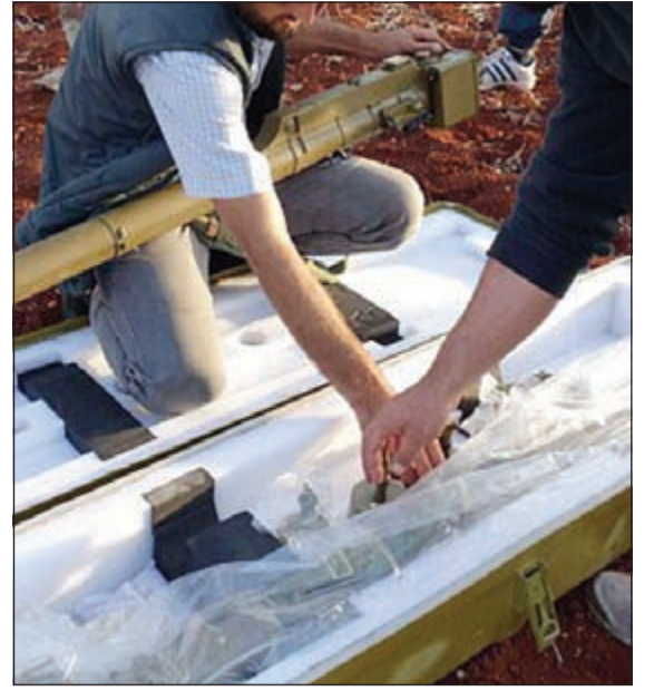
المضيوبات التي تم التحفظ عليها