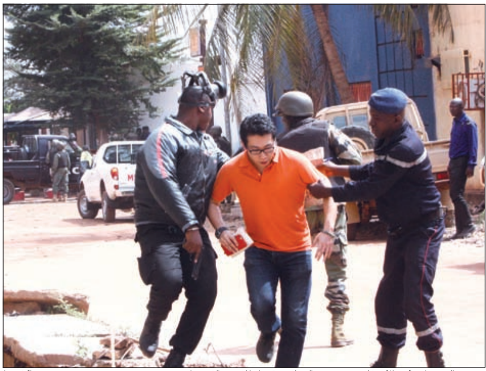
جندي مالي يساعد أحد الأشخاص من ضمن الرهائن عقب إجلائه من الفندق أمس

عواصم - وكالات: بينما كان الاتحاد الأوروبي مستغفراً أمس في اجتماع عاجل لوزراء داخلية في بروكسل لدعم فرنسا على خلفية مجزرة باريس يوم 13 الجاري واتخذ عدة اجراءات أهمها تعزيز الإجراءات الأمنية على حدوده، حط قطار الإرهاب رحاله في فندق راديسون بلو في باماكو عاصمة مالي، بعدما احتجز مسلحون مجهولون 170 رهينة، لكنهم أخلوا بعد ذلك سبيل عشرات الرهائن وأبقوا على عشرات آخرين، تم تحريرهم لاحقاً بعد اقتحام القوات الخاصة المالية للفندق في عملية أدت إلى مقتل ما لا يقل عن 20 شخصاً، وإصابة آخرين بجروح، خلال تبادل لإطلاق النار وعملية احتجاز الرهائن التي انتهت بعد أكثر من 6 ساعات، في عملية إرهابية تبناها تنظيم القاعدة. وتؤكد مقتل رهينة بلجيكي في العملية. وقالت المجموعة المشغلة لفندق راديسون بلو في وقت متأخر من مساء أمس «أن قوات أميركية خاصة تساعد في جهود الإنقاذ في الهجوم على الفندق بمالي». في غضون ذلك، أكد مصدر قريب من الرئيس الفرنسي فرنسيسوا هولاند أن هناك رعايا فرنسيين بين المحتجزين، مضيفاً: «مازلنا ننتظر مزيداً من المعلومات الدقيقة التي يتم التحقق منها. وهل هناك فرنسيون؟ الرئيس يتابع الموقف عن كثب». وفي تصريح منفصل، قال مصدر ديبلوماسي إن فرنسا تقدم دعماً لوجستياً ومخابراتياً. • التفاصيل ص25