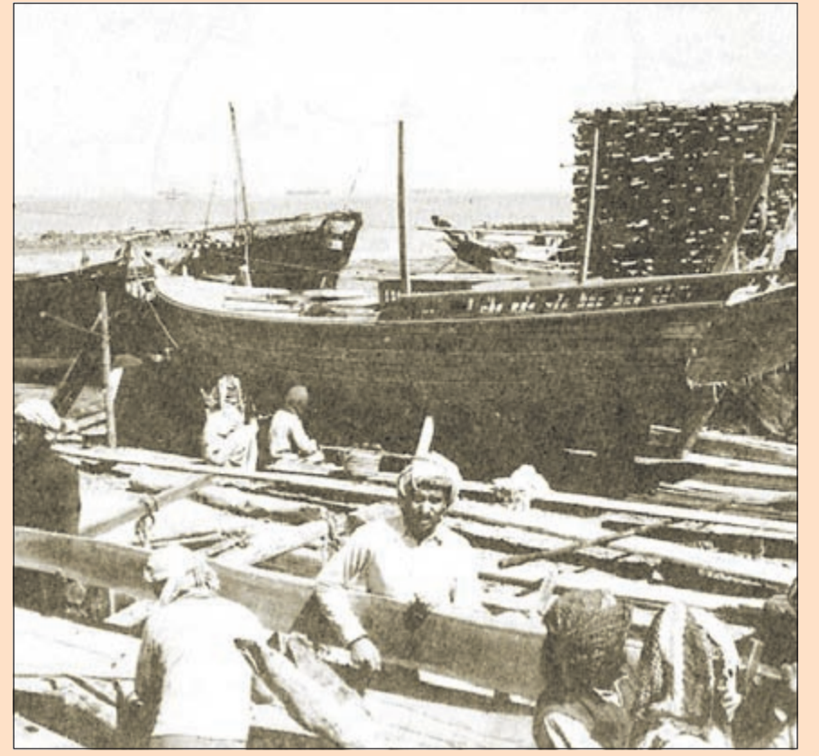
ثلاث صور توضح إتقان وحرفية صناعة السفن قديما