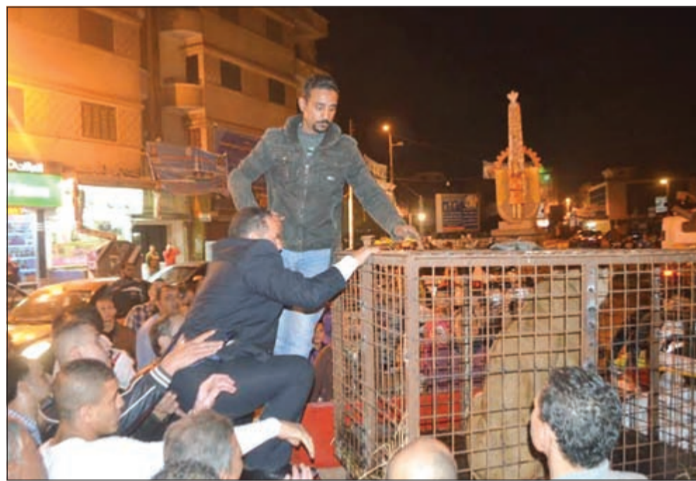
المرشح المصري متجولا بالأسد

إحدى السيارات، للترويج لنفسه بالأسد، مطالبا الأهالي بالتصويت له في الانتخابات. يذكر أنه من المقرر أن تجري المرحلة الثانية لانتخابات مجلس النواب يومي 22 و 23 نوفمبر الجاري.