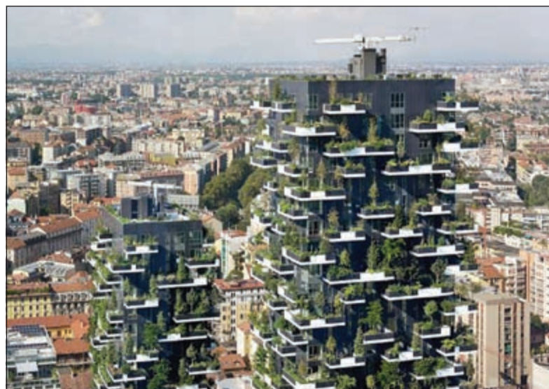
البرج مغطى بالأشجار

ميلانو - وكالات: قرر المهندس المعماري الإيطالي ستيفانو بويري بناء برج سكني تغطي الأشجار الخضراء والنباتات كل طوابقه الـ 36، ليكون الأول من نوعه في سويسرا، والثاني حول العالم بعد برج «برج الأرز» في ميلان بإيطاليا.