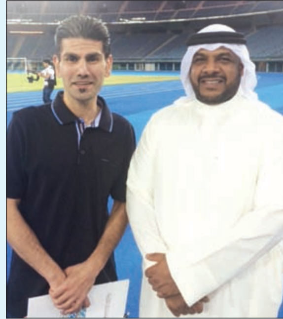
مدير عام الهيئة العامة للرياضة الشيخ احمد المنصور

وتابع حديثه قائلا: الريال سيخوض اللقاء بكل قوة، لاسيما أنه مجروح إزاء خسارته الأخيرة في الليغا، وسيكون الفوز على غريمه التقليدي بمنزلة أجمل هدية لجمهيره بعد التوقف الدولي، لذلك الفوز يهدف نظيف سيني الصراع لمصلحة صاحب الأرض من وجهة نظري الشخصية. وكانت لي وقفة مع مدير عام الهيئة العامة للرياضة الشيخ احمد المنصور الذي تحدث بشغف عن الملحمة الإسبانية بقوله: منذ سنوات ونحن نتابع الدريجات الأوروبية ونتفاعل أحيانا مع الراجح، الا ان مباراة ريال مدريد وبرشلونة تطغى على كل حدث وخير دليل على ذلك ما تخصصه الصحف من حلقات لتسليط الضوء على الفريقين فضلا عما نشاهده من برامج تنطلق قبل فترة الي يوم المواجهه. وأضاف: اتوقع انتصار ريال مدريد على برشلونة بهدفين نظيفين، خاصة ان عاملي الأرض والجمهور سيقفان مع الابيض الي جانب عودة ابرز اللاعبين.