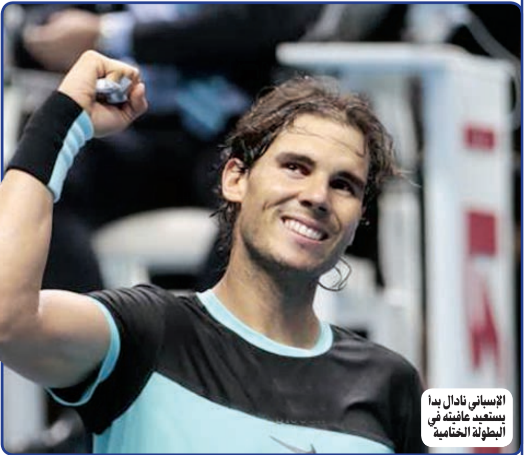
الإسباني نادال بدأ يستعيد عافيته في البطولة الختامية

بلغ الإسباني رافيل نادال المصنف خامسا الدور نصف النهائي الساحق على البريطاني اندي موراي الثاني 4-6 و1-6 في الجولة الثانية من منافسات المجموعة الثانية ضمن بطولة الماسترز للاعبين الـ 8 الأوائل في كرة التنس. وهو الفوز الثاني لنadal بعد الاول على السويسري ستانيسلاس فافرينكا، فيما مني موراي بخسارته الاولى بعد تغلبه على الإسباني الآخر دافيد فيرر. وضمن نادال بلوغه دور الـ 4 واللاحق بالسويسري الآخر روجيه فيدرر الثالث الذي حجز بطاقته عن المجموعة الاولى بفوزه على الصربي نوفاك ديوكوفيتش. واحتاج «الماتادور» الي ساعة و31 دقيقة للتغلب على «الفتى المدلل» للجمهور البريطاني محققا فوزه الخامس على موراي في 5 مباريات جمعت بينهما في لندن (بطولة الماسترز وبطولة ويمبلدون، ثلثة البطولات الأربع الكبرى). والفوز السادس عشر لنadal على موراي في 22 مباراة جمعت بينهما. وتأز نادال لخسارته أمام موراي في المباراة النهائية لدورة مدريد هذا العام. يذكر ان كلا من نادال وموراي يشاركان في بطولة الماسترز للمرة السابعة في مسيرتهما ولم يسبق لاي منهما التتويج بلقبها، حيث كانت أفضل نتيجة للإسباني وصيف البطل عامي 2010 و2013، وللبريطاني الدور نصف النهائي أعوام 2008 و2010 و2012. وفي المباراة الثانية، أنعش فافرينكا آماله في التأهل الي دور الـ 4 بفوزه على فيرر 7-5 و2-6 في ساعة و33 دقيقة. وعوض فافرينكا خسارته أمام نادل في الجولة الاولى، وانحصرت البطاقة الثانية عن المجموعة بينه وبين موراي عندما يلتقيان اليوم، فيما خرج فيرر خالي الوفاض بتلقيه الخسارة الثانية على التوالي وستكون مواجهته مع مواطنه نادال ايضا تأدية واجب بالنسبة له ليس إلا.