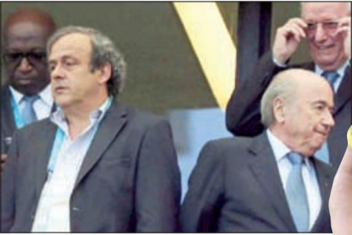
ضربة جديدة لبلاتر وبلاتيني

أكد الرئيس المستقيل للاتحاد الدولي لكرة القدم (فيفا) السويسري جوزيف بلاتر «عزمه على تلميع سمعته»، فيما أعلن رئيس الاتحاد الأوروبي للعبة الفرنسي ميشال بلاتيني أنه سيلجأ الي محكمة التحكيم الرياضي (كاس) بعدما رفضت لجنة الاستئناف في الفيفا الطعون المقدمة من طرفهما مؤكدة عقوبة الإيقاف المتخذة بحقهما من قبل الغرفة القضائية في لجنة الأخلاق المستقلة في المنظمة الدولية. وأعلن بلاتر عبر محاميه «استياءه» لرفض استئنافه بخصوص إيقافه المؤقت، لكنه أكد «عزمه على تلميع سمعته»، وكتب المحامي ويشار كولن في بيان له: «الرئيس بلاتر مستاء من القرار الذي أصدرته لجنة الاستئناف بخصوص إيقافه المؤقت، لكنه عازم على تلميع سمعته»، مؤكدا أنه ليس هناك «دليل على سوء النية في الاتفاق بين ميشال بلاتيني و«فيفا».