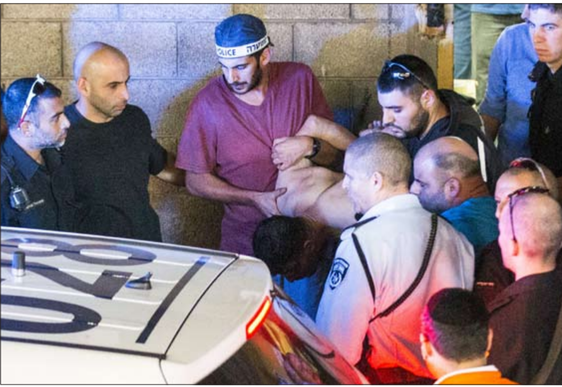
الجيش الإسرائيلي يعتقل فلسطينيا جريحا يعتقد انه منفذ عملية الطعن في تل أبيب

عواصم - وكالات: قتل ثلاثة مستوطنين إسرائيليين وجرح تسعة آخرين، في هجومين منفصلين أحدهما في تل أبيب والآخر في الضفة الغربية المحتلة.