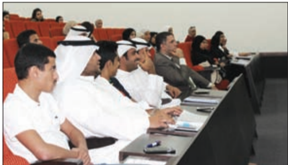
عدد من الطلبة خلال الندوة

المحققين حصانة تلزمهم باتباعها حتى في حياتهم الخاصة وليس فقط خلال أدائهم لعملهم. وأشار إلى أن إدارة التحقيقات تخصص بالتحقيق والتصرف والإدعاء في الجرح العامة والخاصة، ومنها على سبيل المثال إساءة استخدام الهاتف وقضايا البيئة وحماية الثروة السمكية وقضايا العمل في القطاع الأهلي ودعم العمالة الوطنية وأملاك الدولة وحوادث السير والسرقات وسوى ذلك من جنح وقضايا يعمل المحققون على متابعتها على مدار الساعة بنزاهة تامة تصل إلى 100٪، حيث يفرض القانون على المحقق أن يتفرغ بشكل كامل لوظيفته، ولا يمارس أي عمل تجاري، وفي نفس الوقت عدم الإذلاء بأي رأي سياسي، والاستقالة في حال رغبتة في الترشح إلى مجلسي الأمة أو البلدي. وحول الشروط الخاصة الواجب توافرها فيمن يرغب بالعمل محققا قال الغريب: إن من أبرز الشروط أن يكون المتقدم حاصلا على إجازة جامعية في الحقوق أو الحقوق والشريعة، ولا يقل معدله عن 80٪، واما، يزيد عمره على 25 عاما، وأن يجتاز الاختبار الخاص بإدارة التحقيقات وكذلك المقابلة الشخصية، أما من أهم الشروط العامة التي تضمنها القانون فهي أن يكون المتقدم كويتي مسلما كامل الأهلية غير محكوم عليه قضائيا أو تأديبيا وحسن السلوك ومحمود السيرة.