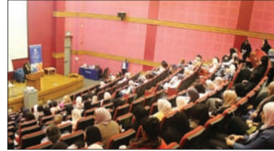
جانب من الحضور خلال ورشة العمل