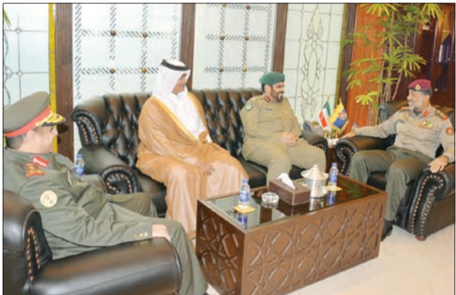
الفريق الركن عبدالله النواف مستقبلا اللواء الركن هزاع بن خليل

وتناقش الجانبان أهم الأمور والمواضيع ذات الاهتمام المشترك لاسيما المتعلقة بالجوانب العسكرية وسبل تطويرها وتعزيزها. وأشاد الفريق الركن عبدالله النواف بعمق العلاقات الأخوية والتعاون المستمر بين البلدين الشقيقين. حضر اللقاء سفير قطر لدى البلاد حمد بن عيسى آل حنزاب، فيما حضر من الجانب الكويتي معاون رئيس الأركان لهيئة العمليات والخطط اللواء الركن أحمد العميري وأمر الحرس الأميري العميد الركن فهد الزيد ومساعده أمر الحرس الأميري العقيد الركن حمد الصالح.