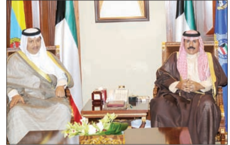
سمو ولي العهد الشيخ نواف الأحمد مستقبلا سمو الشيخ جابر المبارك

الشيخ جابر المبارك. واستقبل سموه بقصر بيان صباح امس النائب الأول لرئيس مجلس الوزراء وزير الخارجية الشيخ صباح الخالد. كما استقبل سمو ولي العهد الشيخ نواف الأحمد