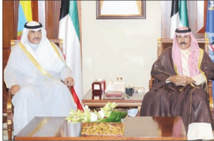
سمو ولي العهد الشيخ نواف الأحمد مستقبلا الشيخ صباح الخالد