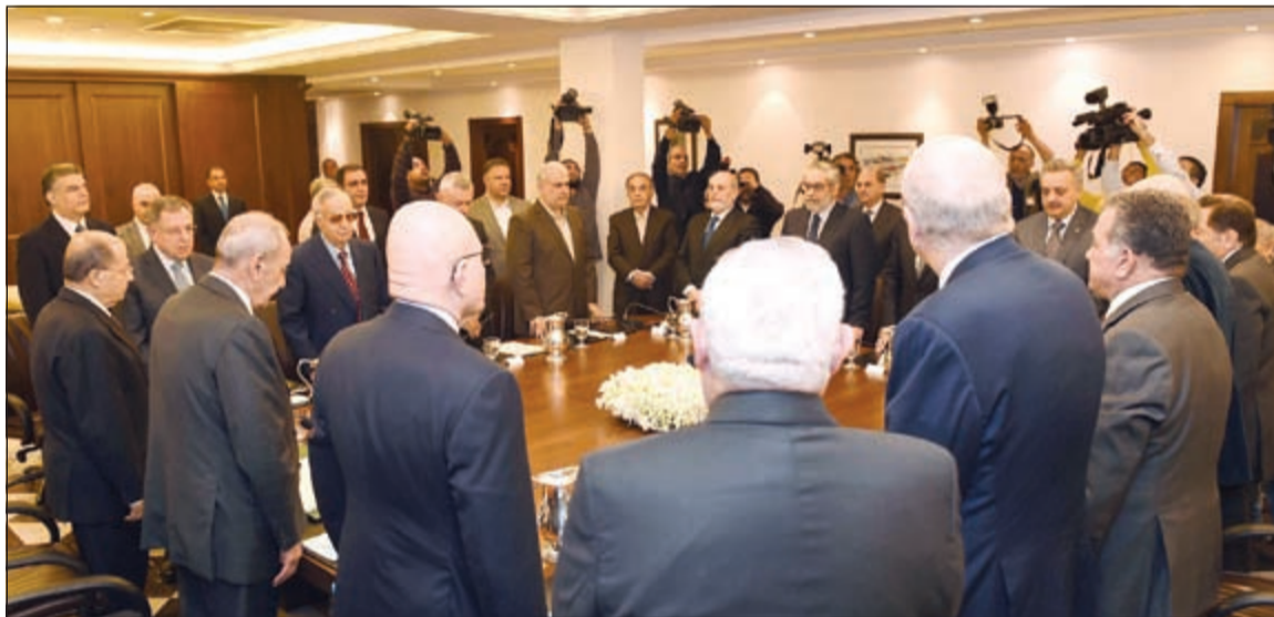
المحاورون يقفون دقيقة صمت في عين التينة أمس

وردا على سؤال حول تحول السيد حسن نصرالله من منتقد لشعبة المعلومات الى معترف بقدراتها، لفت جابر في تصريح لـ «الأنباء» إلى ان احدا لا يستطيع التنكر للانحاز الكبير الذي حققته شعبة المعلومات في القاء القبض على باقي افراد الشبكة الإرهابية، معتبرا بالتالي ان السيد نصرالله بادر إلى شكر شعبة المعلومات