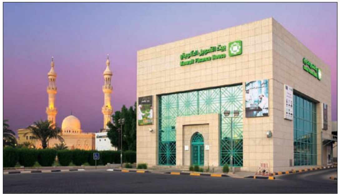
أحد فروع بيت التمويل الكويتي

المستورد ومصرفه خارج الكويت، يقوم بموجبه عميل «بيتك» بتصدير منتجاته إلى المستورد خارج الكويت، ومن ثم الحصول على قيمتها عند استيفاء مواصفات البضاعة المصدرة.