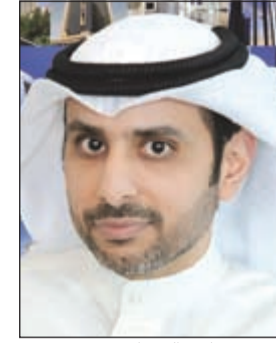
الشيخ مبارك الصباح