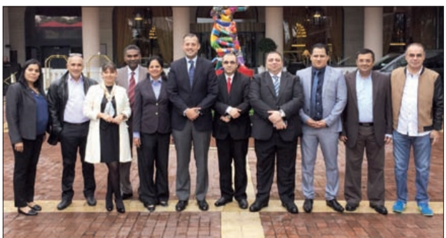
لقطة جماعية خلال الرحلة