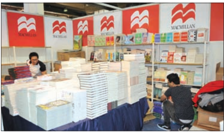
إحدى دور النشر الأجنبية