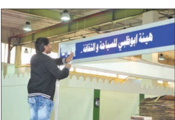
جناح هيئة أبوظبي