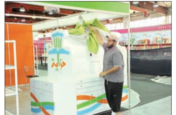
أحد الأجنحة في طور التجهيز