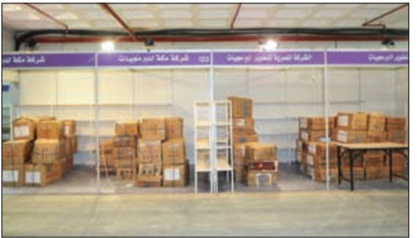
كرايتن الكتب في أحد الأجنحة قبيل وضعها للمعرض

العربية على المشاركة إضافة إلى القسائر الكويتي والمقيم من النخب المثقفة التي تحرص على اقتناء كل جديد من إصدارات دور النشر الكويتية والعربية والأجنبية. وأوضح أن تلك المشاركات تعكس الغراء الأدبي الذي يمنحه المعرض إلى جانب الناحية الاقتصادية التي تسهم في انتعاش صناعة الكتاب عربيا وفي الكويت على وجه الخصوص. وذكر أن هناك دور نشر تشارك لأول مرة من الجزائر والمغرب وليبيا ولبنان ومصر والأردن وبريطانيا إضافة إلى عدد من دور النشر المحلية