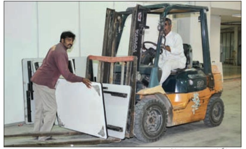
إحدى الآليات تنقل تجهيزات الأجنحة

الطفل بالمجلس الوطني ستشارك بجناح خاص لتقديم برنامج مسابقات حافل بالتعاون مع مؤسسة (كينزانيا) لجذب جمهور المعرض من الأطفال والناشئة حيث ستتم إقامة مسابقات يومية وتوزيع الجوائز على الأطفال مما يجذبهم في زيارة المعرض ويضفي جوا من الفرح لديهم.