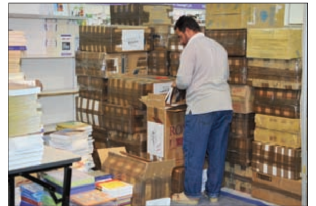
سباق مع الزمن