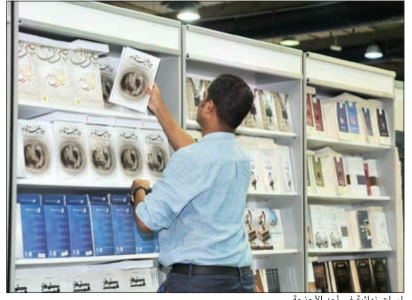
لمسات نهائية في أحد الأجنحة

وزير الإعلام يفتتح دورته الـ 40 اليوم نيابة عن رئيس الوزراء بمشاركة 508 دور نشر عربية وأجنبية