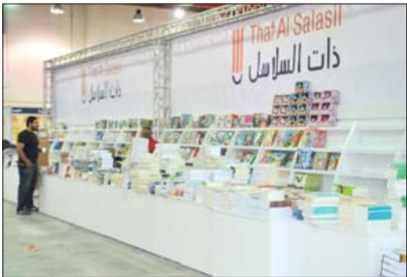
جناح ذات السلاسل بانتظار زوار المعرض