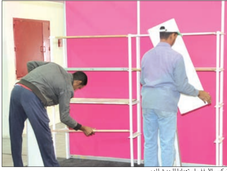
تركيب الأرفف استعدادا للحدث المهم