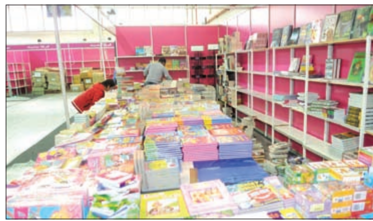
من أجنحة المعرض