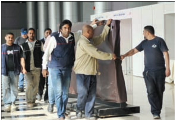
استعدادات على قدم وساق