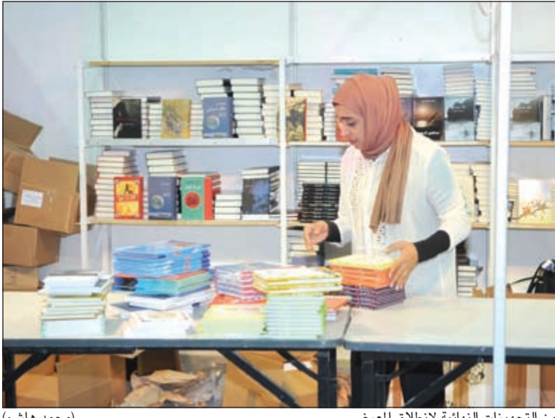
من التجهيزات النهائية لانطلاق المعرض (محمد هاشم)