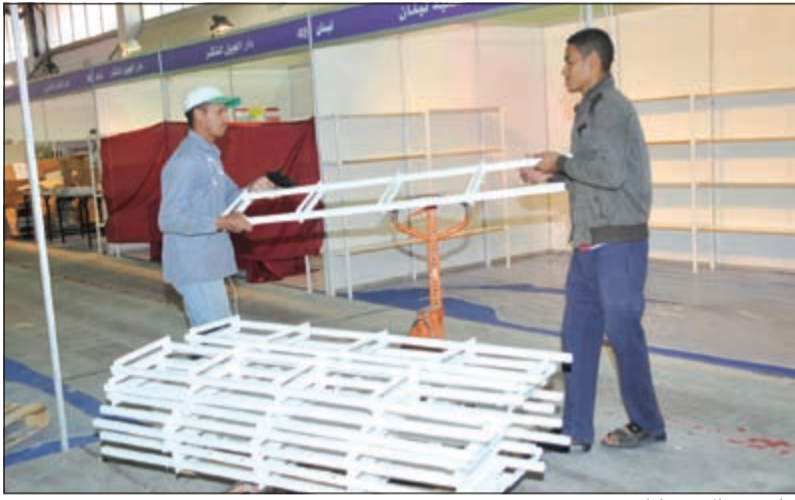
جانب من الاستعدادات