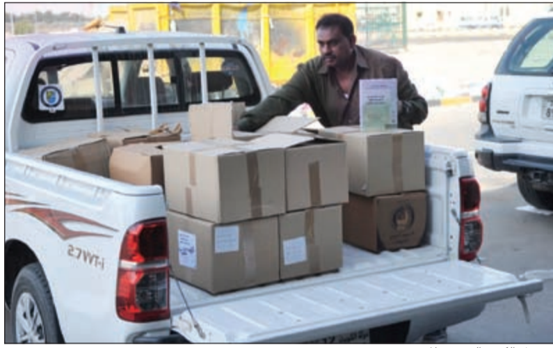
وصول الكتب إلى مقر المعرض