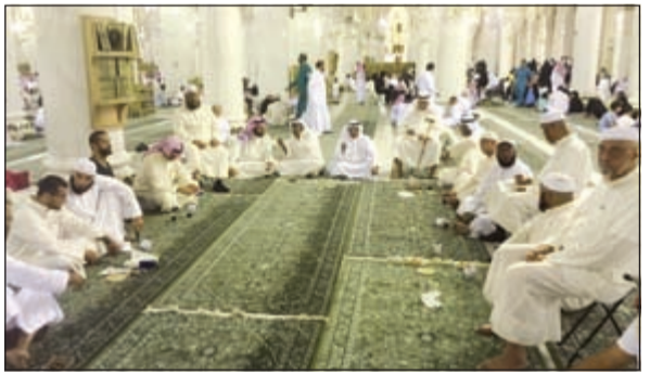
المشاركون في عمرة تعاونية الفيحاء خلال تواجدهم في الحرم

وأضاف الهويدي أن الرعاية والعناية والاهتمام بالمساهمين بدأ من اللحظات الأولى للانطلاق والوصول إلى مطار جدة حيث كان بانتظارهم وفد إداري قام بالترحيب بهم وتوزيع العصائر والمشروبات قبل ركوب الحافلات مع استقبال مميز لهم لحظة وصولهم إلى فندق التوحيد وتسليم مفاتيح الغرف الفندقية التي راعت فيها تلبية رغبات المعتمرين، وتنوع البرنامج المصاحب للرحلة بعمل رحلة تسوق إلى منطقة