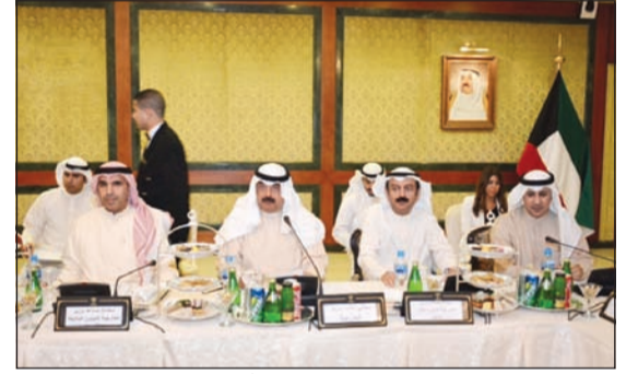
خالد الجارالله ترأس اجتماع الجهات المشاركة في أعمال اللجنة الكويتية - العراقية

وترأس نائب وزير الخارجية خالد الجارالله أمس اجتماعاً تمهيدياً للوزارات والمؤسسات الكويتية المشاركة في أعمال اللجنة الكويتية - العراقية المشتركة في دورتها الخامسة المقرر عقدها في النصف الثاني من ديسمبر المقبل. وتم خلال الاجتماع استعراض البنود الواردة على جدول الأعمال وملاحظات الوزارات والمؤسسات عليها. كما اجتمع الجارالله في وقت لاحق مع رئيس مندوبية الاتحاد الأوروبي لدى الرياض السفير آدم كولاخ الذي يقوم