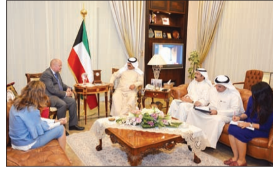
الجارالله مستقبلا رئيس مندوبية الاتحاد الأوروبي لدى الرياض السفير آدم كولاخ

التقى رئيس مندوبية الاتحاد الأوروبي لدى الرياض الجارالله ترأس اجتماعاً تمهيدياً للجهات المشاركة في أعمال اللجنة الكويتية - العراقية المشتركة