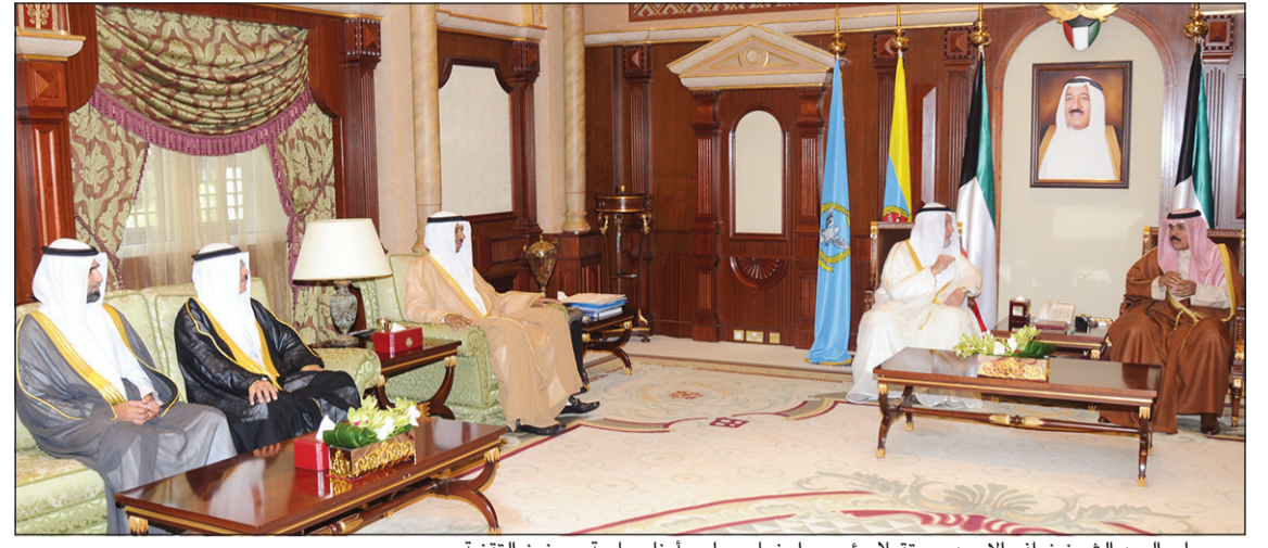
سمو ولي العهد الشيخ نواف الاحمد مستقبلا رئيس واعضاء مجلس أمناء جامعة ميونخ التقنية

سموه التقى المستشار الخاص لخدام الحرمين الشريفين ولي العهد استقبل المحمد ومجلس أمناء جامعة ميونخ