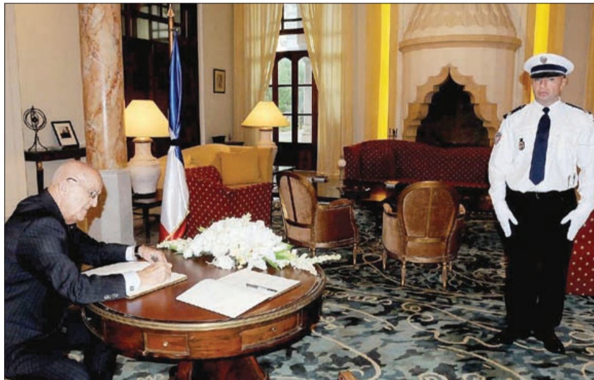
وزير الدفاع سميير مقبل يكتب رسالة تعزية في سجل التعازي في السفارة الفرنسية في بيروت