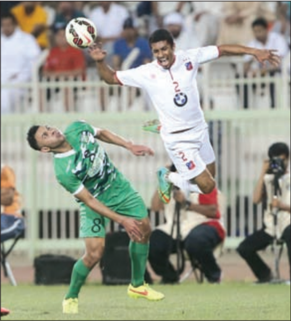
مواجهة تارية بين الأبيض والأخضر (الأزرق:كوم)

وسبق أن التقى الفريقان مرتين بمناسبة مواجهات الدور النصف النهائي لبطولة كأس الاتحاد، حيث فاز الكويت ذهبا 4-0 ونجح العربي في رد اعتباره بالفوز إيابا 2-1 الأمر الذي يضيف بعدا آخر على المباراة لرغبة الفريقين