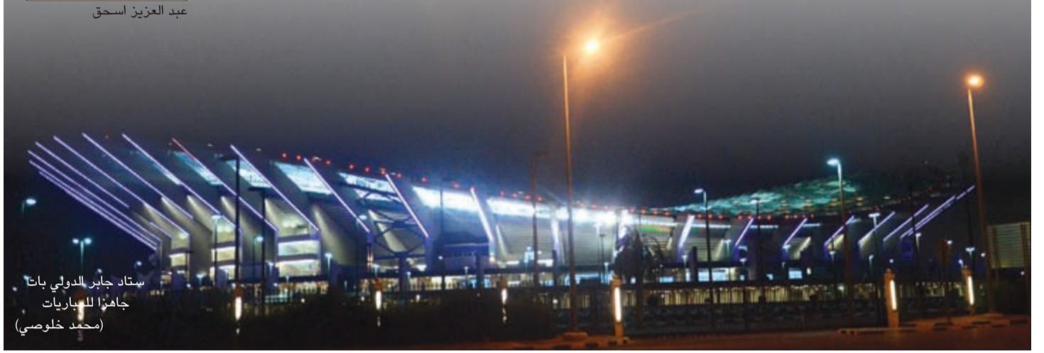
ستاد جابر الدولي بات جاهزا للمباريات

أكدت جولة اللجنة الوزارية التي ترأسها النائب الأول لرئيس مجلس الوزراء ووزير الخارجية الشيخ صباح الخالد إلى ستاد جابر مساء أول من أمس على جاهزية استاد بعد الانتهاء من أعمال الصيانة والتحسينات التي شهدتها مؤخرا.