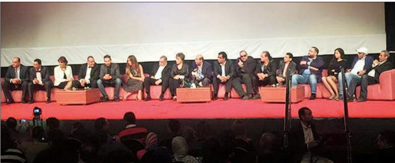
من ندوة الفيلم