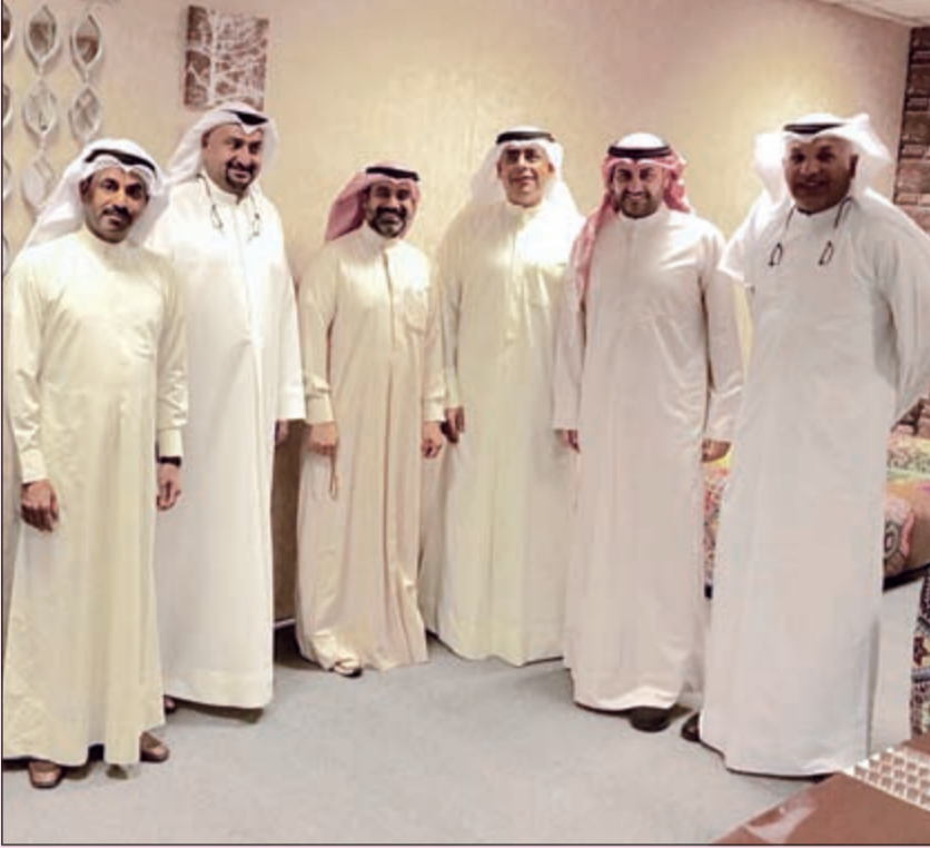
لقطة جماعية لأعضاء الرابطة مع أعضاء النقابة