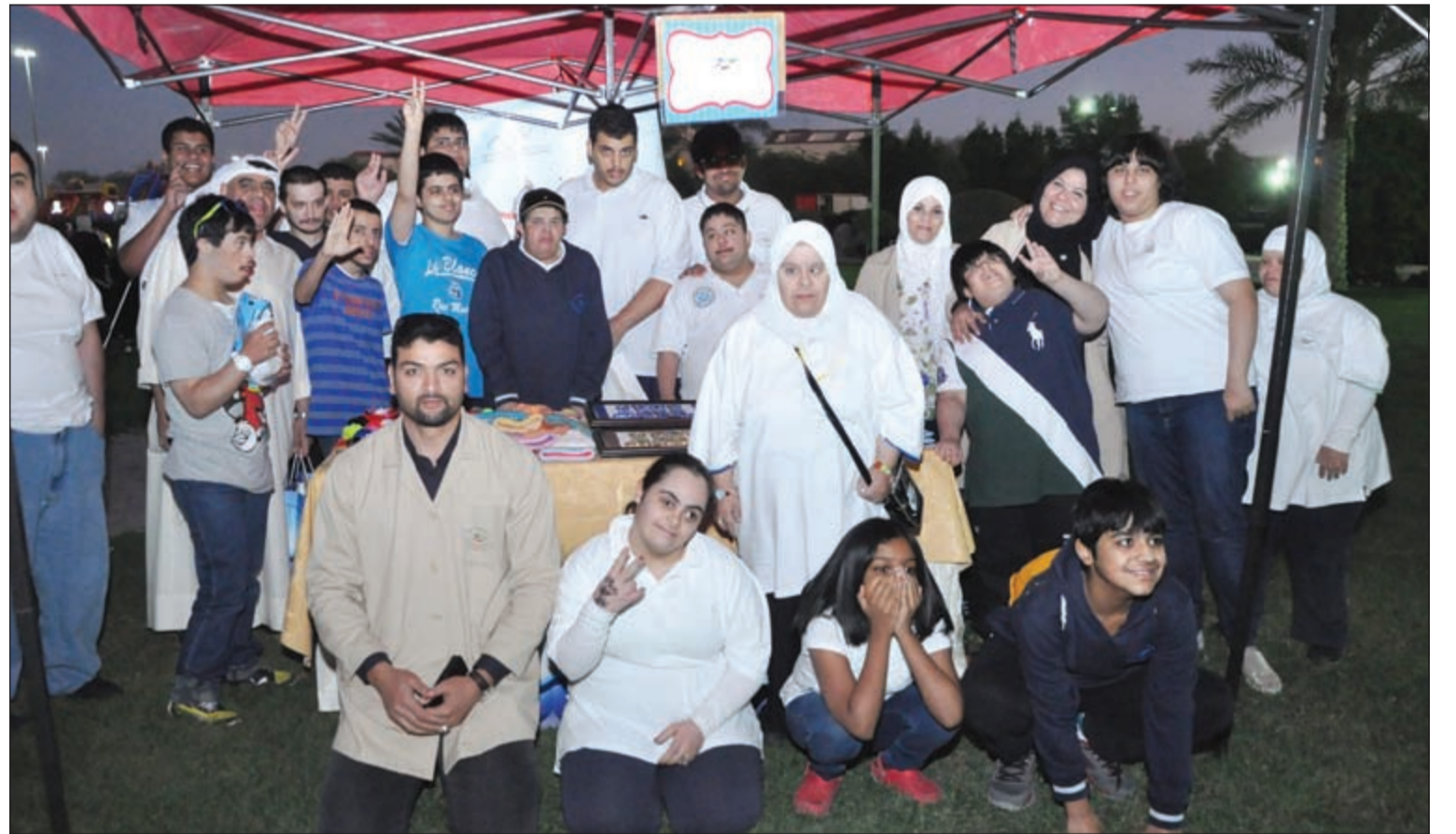
فريق «عبير 2» التطوعي

للجميع وخصوصاً أطفال الداون، فضلاً عن ألعاب bubble football، paintball وغيرها من الفقرات المتنوعة. وكشفت الفليج عن أن النسخة الرابعة من الكرنفال العام القادم سيخصص ريعها للأطفال المصابين بمرض السرطان.