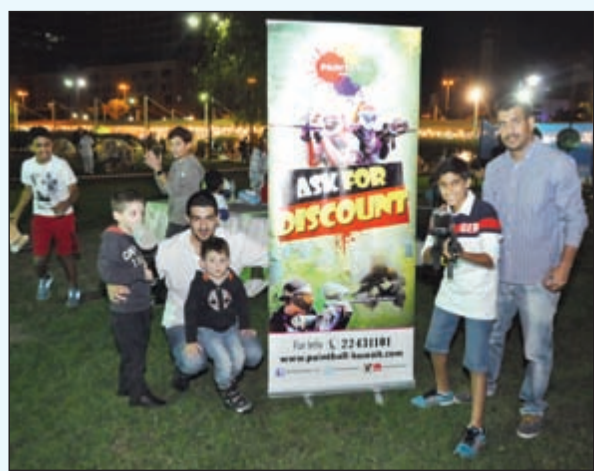
العب وترفيه جمع مختلف أفراد الأسرة