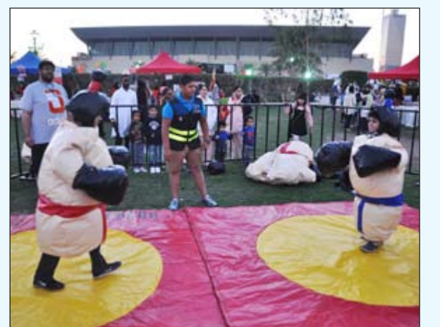
أوقات مرحة تضاهي الكبار والصغار