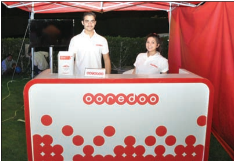
ممثلو شركة ooredoo أحد رعاة الكرنفال