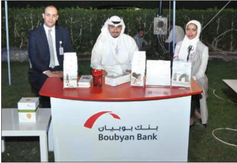
ممثلو بنك بويان أحد رعاة الكرنفال

كرة والمتوسطة ويوفر نافذة لعرض منتجات أصحابها