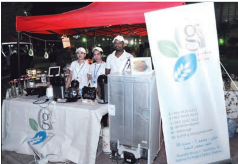
مشاركة مميزة من مطعم Garden & Grain