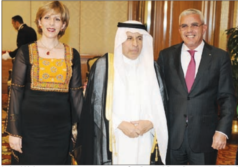
السفير السعودي د.عبدالعزیز الفایز يقدم التهنية (شائاناس قاسم)