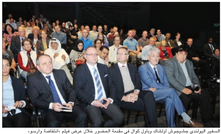
السفير البولندي جشيجوش أولشاك وباول كوال في مقدمة الحضور خلال عرض فيلم «انتفاضة وارسو»

فيها انتفاضة وارسو والتي استمرت 63 يوماً بوجه الاحتلال النازي وما عاش الناس خلال تلك الفترة من مشاعر ومصاعب حياتية، وكيف حاول البولنديون من