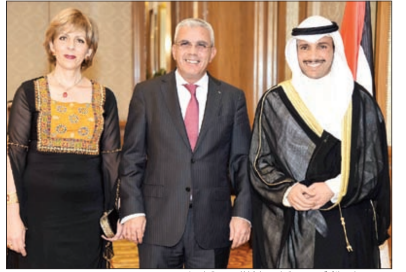
رئيس مجلس الأمة مرزوق الغانم مباركا للسفير الفلسطيني

أكد خلال مشاركته في الاحتفال بعيد الاستقلال الفلسطيني أن هذه القضية في سلم أولويات القادة الخليجيين