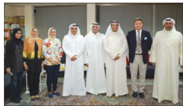
صورة تجمع اللجنة العليا لمعرض الاختراعات ورئيس وأعضاء الجمعية الاقتصادية