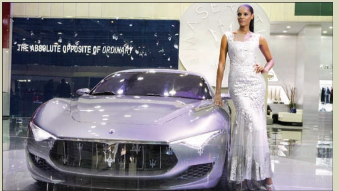
جنح مازيراتي في معرض دبي الدولي للسيارات

أطلقت مازيراتي، للمرة الأولى في الشرق الأوسط مستويات جديدة من التخصيص مع مقصورات داخلية حصرية من إرمينجيلدو زينيا بمعرض دبي الدولي للسيارات هذا العام. ومثل مازيراتي، تتمتع إرمينجيلدو زينيا بأكثر من مائة سنة من التراث الإيطالي، واليوم هي واحدة من أبرز العلامات التجارية الفاخرة الرجالية والتي تصنع أرقى النسوجات والأقمشة في العالم. وتتعاون مازيراتي وإرمينجيلدو زينيا في تطوير المقصورة الداخلية من الجلد الإيطالي الفاخر مع حشوات من الألياف الطبيعية 100٪ من حرير زينيا. ويتواجد هذا الحرير في المقاعد والوحدات الأبواب والسقف وحاجب أشعة الشمس. لتمنح المقاعد والوحدات الأبواب لسة من الفخامة مع درزات بلون مختلف عن الجلد. وشعار مازيراتي الشهير على مساند الرأس. وتتوافر المقصورة الداخلية بثلاثة خيارات من الألوان وستكون هذه الميزة الحصرية من بين أفضر باقات التخصيص من مازيراتي.