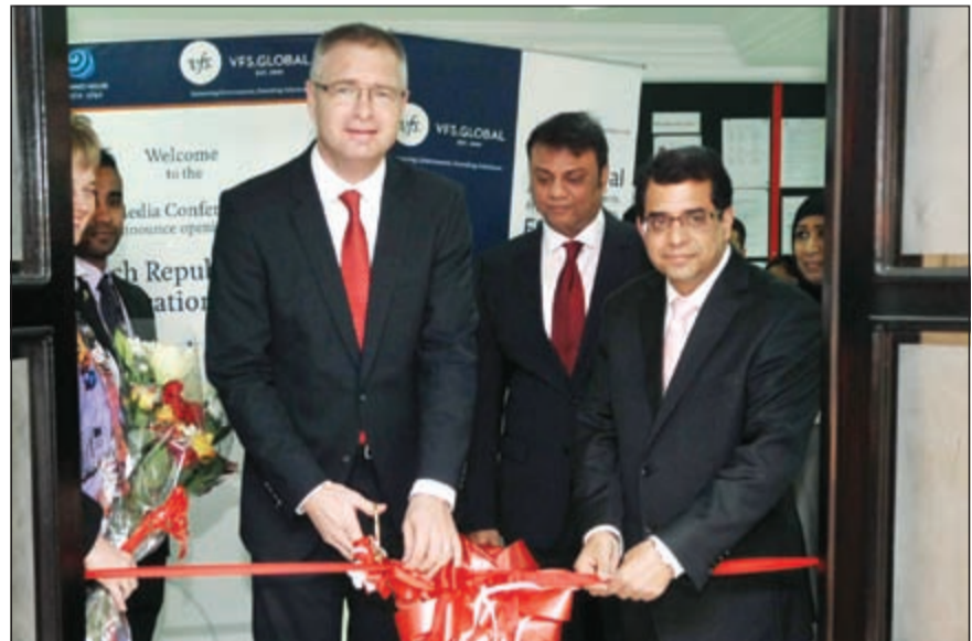
سفير التشيك مارتن فيتيك يقص شريط افتتاح مركز التأشيرات (محمد هاشم)

به الخطوط الجوية الكويتية وأيضا الأزمة المالية التي تمر بها الخطوط التشيكية، مبينا ان عدد الجالية التشيكية في الكويت لا يتعدى 60 شخصا من ضمنهم طاقم السفارة. وعن مواجهة بلاده لمشكلات متعلقة باللاجئين السوريين، قال ان المشكلة كبيرة جدا ويعاني منها جميع الدول الأوروبية والتشيك جزء من هذه المنطقة ومن أحد الحلول التي طرحت توزيع هؤلاء اللاجئين على عدد من الدول الأوروبية وسيكون نصيبنا 1000 لاجئ خلال الأشهر القليلة المقبلة، لافتا الى ان هذا الأمر أصبح يشكل تحديا للدول الأوروبية بصفة عامة، مبينا ان الكويت تقوم بعمل إنساني جبار في مجال المساعدة الإنسانية للشعب السوري وتبرعت بمبالغ كبيرة جدا تصل إلى مليار دولار لمساعدته. وعن قطاع السياحة في بلاده، أوضح ان الكويتيين لديهم الخبرة الكبيرة بما تحتويه بلاده من مميزات سياحية وصحية، مبينا ان العدد الذي يزور التشيك من الكويتيين يفوق الـ 6 آلاف سنويا، نافيا وجود أي استثمارات كويتية مباشرة في بلاده، قائلا إن هناك استثمارات لمشروعات صغيرة تقوم بها الهيئة العامة