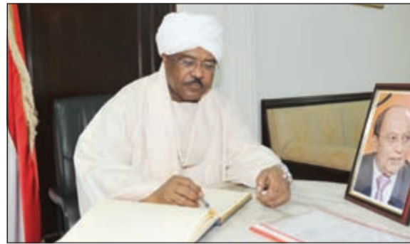
..وسفير السودان محيي الدين سالم يسجل كلمة