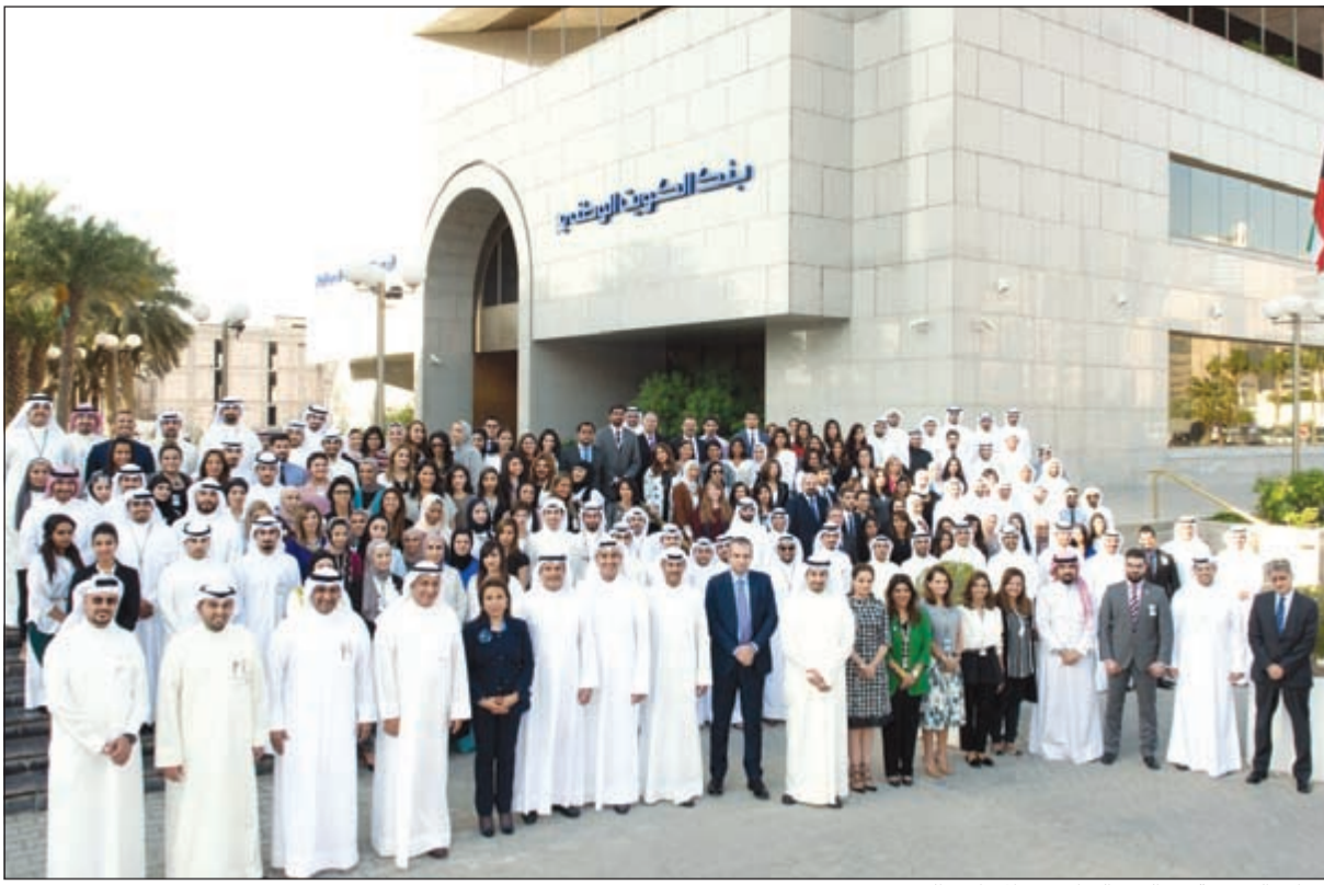
الإدارة التنفيذية في البنك الوطني مع الموظفين الجدد

الشابة وفتح المجال أمامها لبناء مسيرة مهنية في أفضل بنوك المنطقة. وأضاف الفليج أن بنك الكويت الوطني يولي اهتماماً خاصاً بالمواهب الوطنية الشابة وقد وضع برامج خاصة لتطويرها وضمان ارتقاها في السلم الوظيفي، حيث قام البنك بتوفير أكثر من 1300 فرصة تدريبية للموظفين لإعداد الكفاءات والقيادات المصرفية الواعدة، وذلك بالتعاون مع أبرز المعاهد والجامعات العالمية. ونحن في بنك الكويت الوطني نعزز بأن نرى شبابنا في مواقع قيادية داخل البنك، لأن هذا ما يضمن الاستمرارية والتطور المستمر، ومن هذا المنطلق فإننا في بنك الكويت الوطني سنبقى الداعم الأكبر للكوادر الوطنية وملتمزين بالوقوف إلى جانب الشباب الكويتي لتحقيق طموحاته وأهدافه. وتلتقي جهود بنك الكويت الوطني في استقطاب الكفاءات الوطنية بخططه التطويرية والتدريبية الساعية للاستثمار بالكوادر الوطنية وإعداد جيل