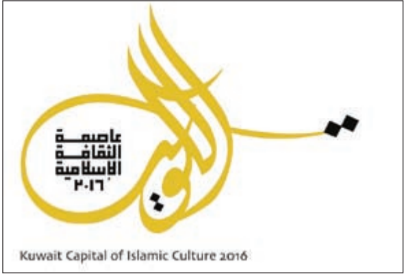
شعار الاحتفالية الجديد

الدورة الـ 22 لمهرجان القرين الثقافي في 18 يناير المقبل. وتأتي احتفالية الكويت كعاصمة للثقافة الإسلامية تنفيذاً للقرار الصادر عن المؤتمر السادس لوزراء الثقافة بدول العالم الإسلامي والذي تهدف الكويت من خلالها إلى تكريس الصورة الحقيقية للإسلام باعتباره ديناً للتسامح والسلام وإبراز الوجه الحضاري والثقافي للكويت بين دول وشعوب العالم. وقد تم تشكيل لجنة علياً برئاسة سمو الشيخ جابر المبارك رئيس مجلس الوزراء وعدد من الوزراء، وكذلك لجنة أخرى برئاسة وزير الإعلام ووزير الدولة لشؤون الشباب ورئيس المجلس الوطني للثقافة والفنون والآداب الشيخ سلمان الحمود إيماناً من الحكومة بأهمية هذه الاحتفالية للخطط والتنفيذ والإشراف على الفعاليات المختلفة طوال العام المقبل.