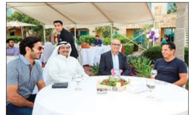
متابعة من الحضور

فريق وإدارة المجموعة». تعد شركة الأرجان العالمية العقارية شركة رائدة عقارية مدرجة في بورصة الكويت، تركز على تطوير المساكن بأسعار متاحة للجميع ولأصحاب الدخل المتوسط في دول مجلس التعاون الخليجي. وتبذل الشركة جهودها لدمج شعارها «الحياة.. كما تحبها»، في مشاريعها عبر خلق بيئة تمزج بين العيش والعمل واللعب والاكل، بما يقدم نموذج حياة فريدة. وتتسم مشاريع الشركة بالتنوع، وتتركز في منطقة الخليج: دولة الكويت، المملكة العربية السعودية، مملكة البحرين، سلطنة عمان، وتنشط الشركة