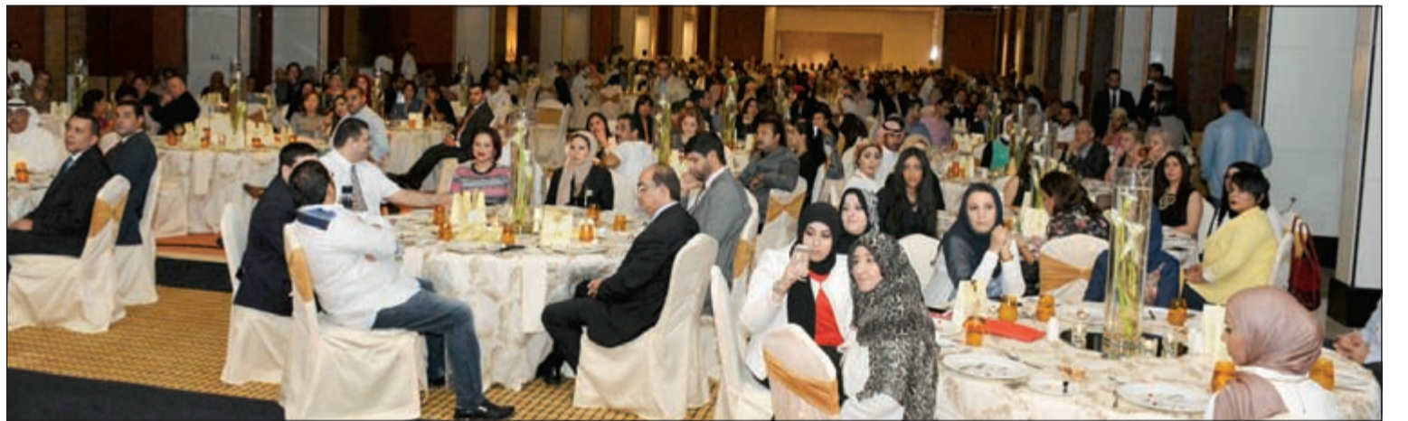
جمع غفير من الحضور في حفل فندق ومركز المؤتمرات ميلينيوم

في احدي أكبر القاعات وأكثرها رقياً وتحت وقع الموسيقى الكلاسيكية الحية وبوفيه الماكولات العالمي الشهى، أقام فندق ومركز مؤتمرات ميلينيوم الكويت مأدبة عشاء دعا من خلالها عدداً من كبار الشخصيات ومثلي وسائل الإعلام في الكويت ليقوم من خلالها بتسليط الضوء على أرجاء الفندق الذي افتتح مؤخراً. وحضر الحدث المدير العام لفنادق ومنتجعات ميلينيوم