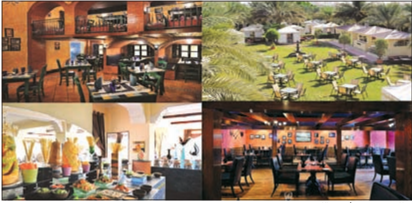
مطاعم فندق موفنبيك الكويت