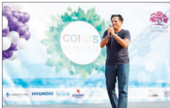
تقديم أحد الفقرات