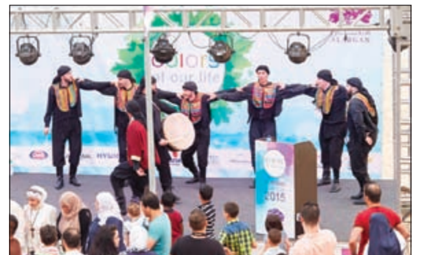
فقره استعراضية للبلبة