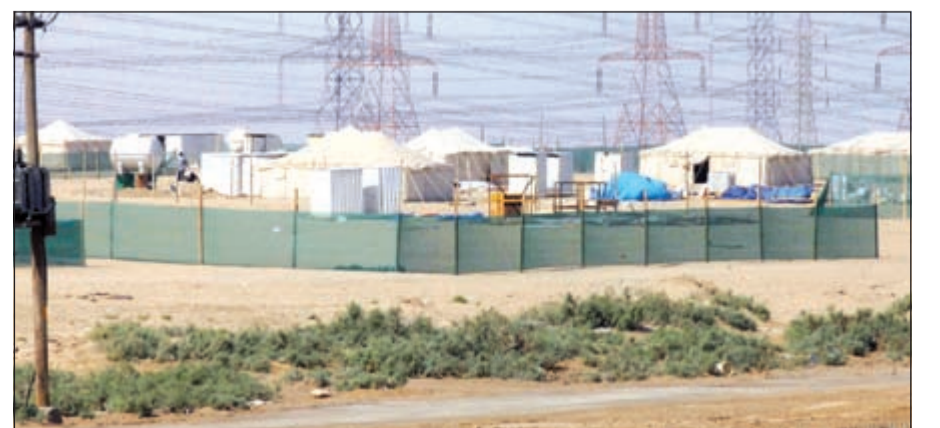
المخيمات وجهة مفضلة لقضاء أمتع الأوقات