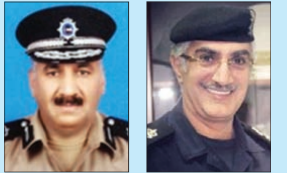
اللواء فهد الشويح