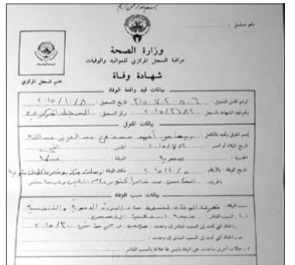
التقرير الطبي للطفلة