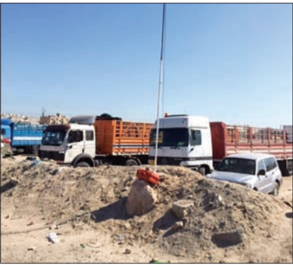
الموقع الذي عثر على الجهاز به في الجليب