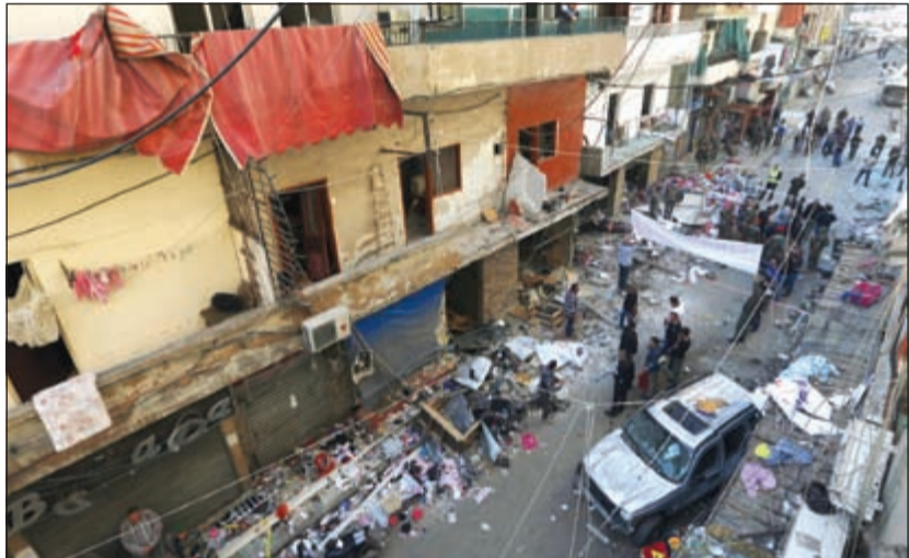
تكتيف الجهود الامنية من الجيش مكان الانفجار في الضاحية امس

لبنان: تشديد الإجراءات الأمنية.. وحداد عام