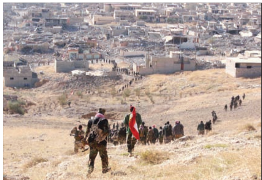
قوات البشمركة الكردية خلال تحرير «سنجار»

قوات البشمركة ملحمة تاريخية وأنا هنا للإعلان عن تحرير سنجار» التي وقعت تحت سيطرة الجهاديين في أغسطس 2014.