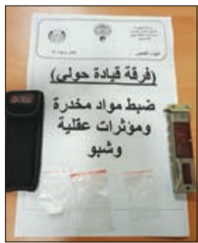
اكياس الشبو التي تم ضبطها

بالإضافة الى 21 حبة حمراء اللون يعتقد انها مؤثرات عقلية، وأحيل إلى جهة الاختصاص. وفي ميدان حولي، اشتبهت إحدى دوريات قيادة أمن حولي في مركبة أميركية بداخلها ثلاثة أشخاص، أحدهم سوري وقلبيبتان تبين ان احدهما عليها إلقاء قبض.