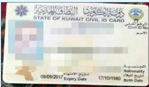
البطاقة المدنية الخاصة بالمتهم