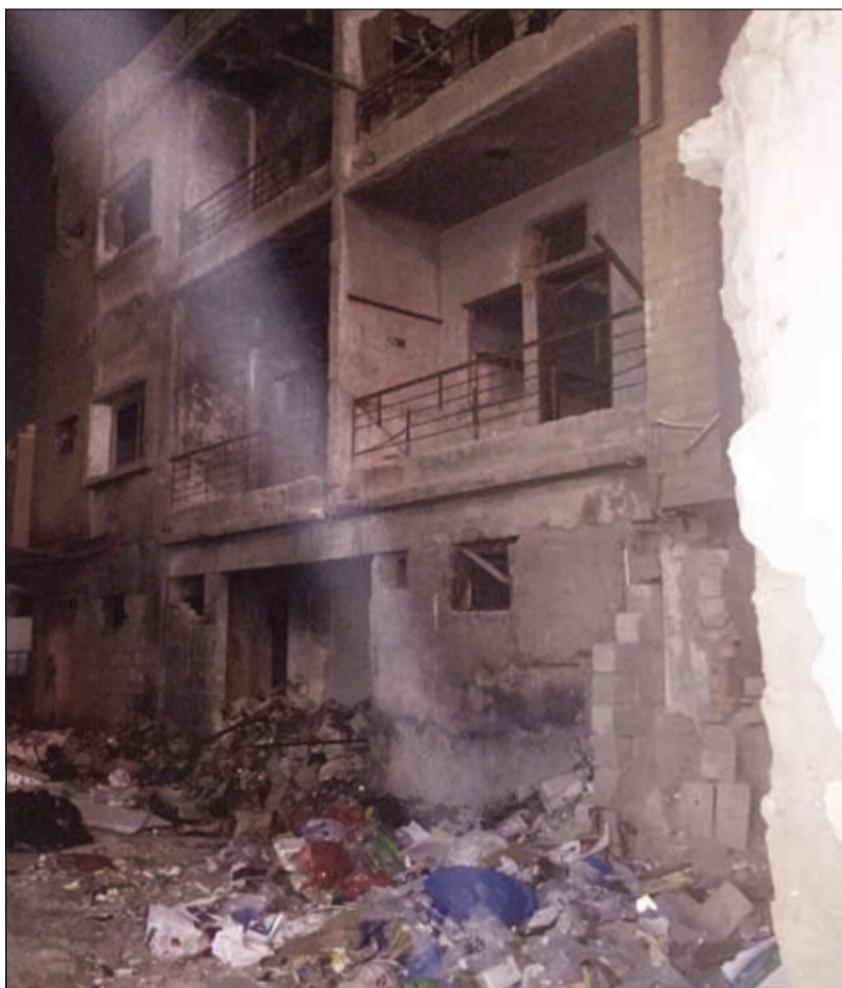
البنية المهجورة التي عثر بها على الجثة