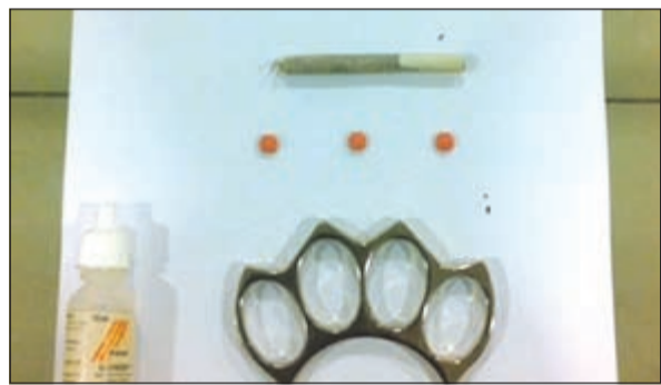
الحبوب وسيجارة الحشيش