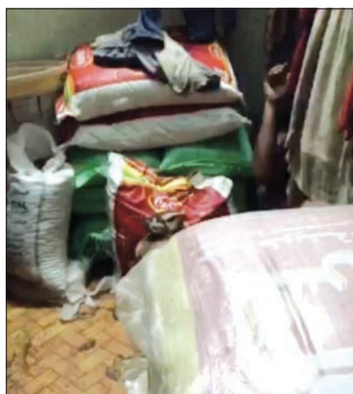
ادوات المطعم تم التحفظ عليها