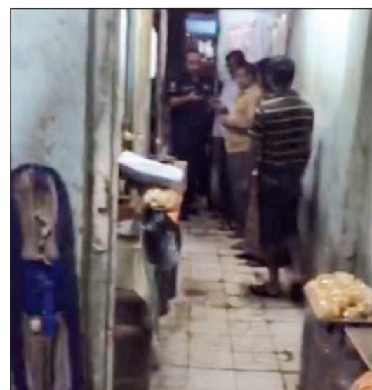
المتهمون بعد ضبطهم من قبل رجال الامن