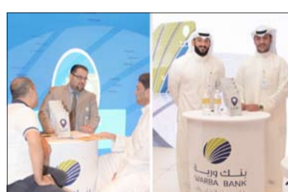
مشاركات البنك في المعرض

حول الجهات الأكثر جانبية. كما شكلت مشاركة البنك في المعرض فرصة مثالية للتعرف على صفقات مهمة ومناسبة لدعم الأنشطة الاقتصادية في البلاد وفي مقدمتها النشاط العقاري لما يمثل من حجم ودور في تحريك عجلة التنمية، إضافة إلى التواصل مع عملاء البنك الحاليين والمحتملين والوقوف عند متطلباتهم وحاجاتهم في هذا القطاع ومحاولة تلبية تطلعاتهم من خلال تطوير وابتكار مجموعة من الخدمات والمنتجات المصرفية المتميزة والحلول التمويلية المتكاملة أبرزها خدمة التمويل الشخصي الذي يتميز بقيمته الكبيرة مع فترة سداد تصل حتى 15 سنة.