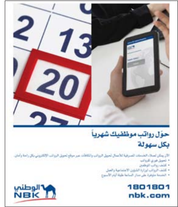
حول رواتب موظفيك شهرياً بكل سهولة

الخضر: البنك يواصل تقديم الخدمات المصرفية الأكثر تطوراً وابتكاراً لعملائه