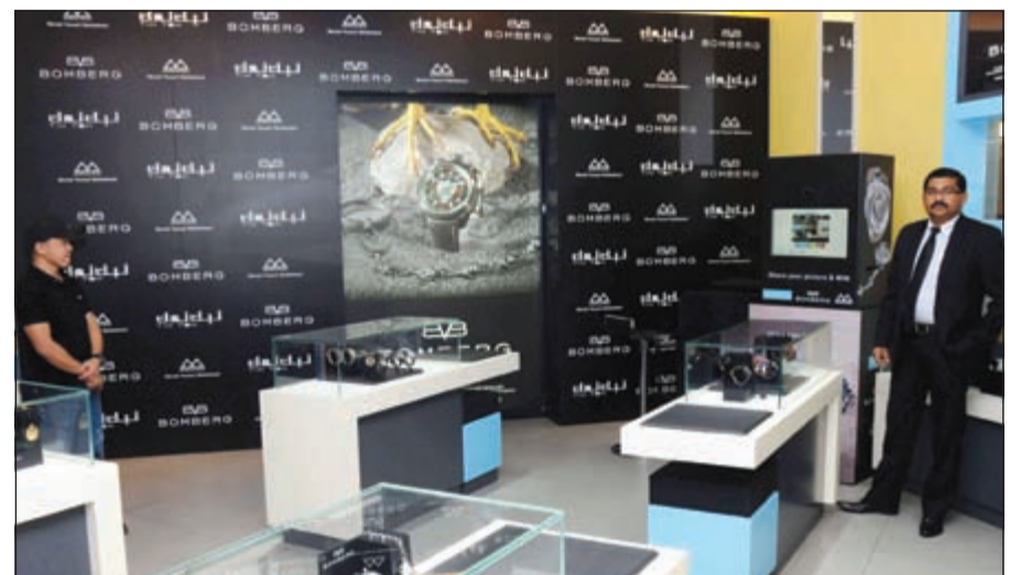
تصميم داخلي رائع لمتجر تيك توك