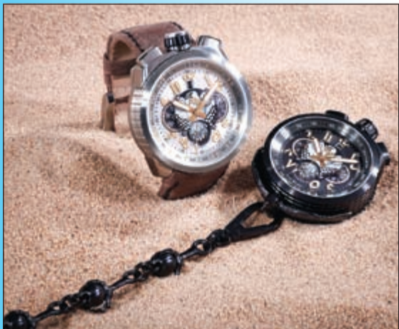
بولت - 68 فالكون