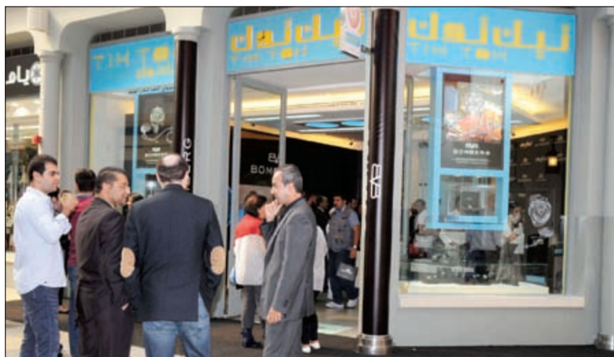
جانب من اطلاق ساعات «بومبورغ» في متجر «تيك توك»