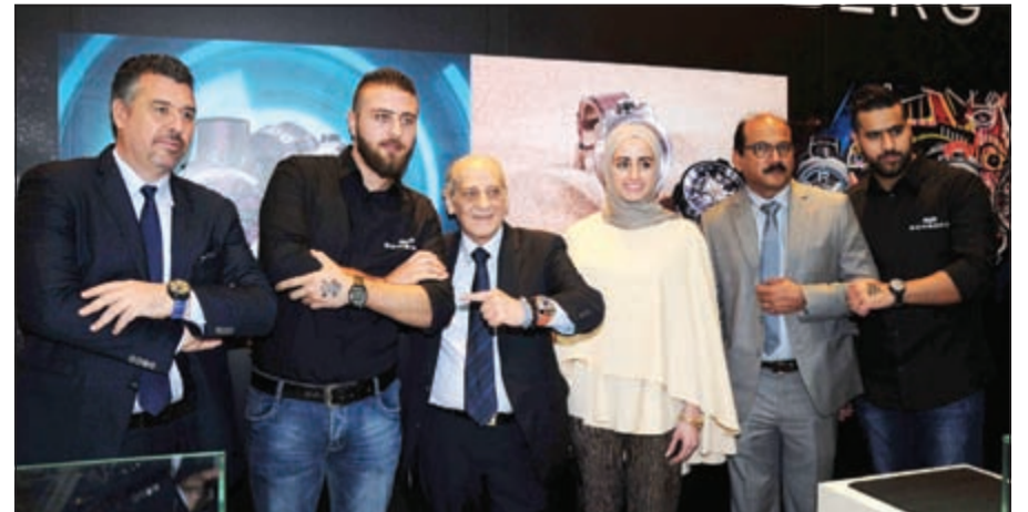
مثيل انيل وامثال معرفي وياك تيديشي وريك دي لاکروا