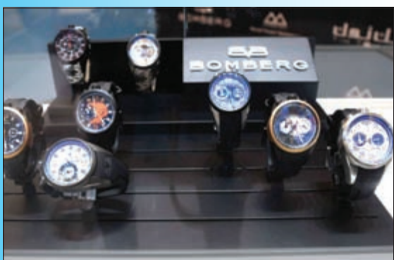
من مجموعة «بومبورغ»