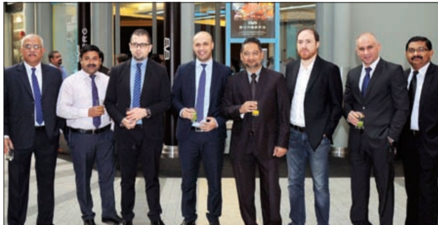
عد من الحضور