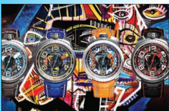
تصاميم مذهلة لـ «بولت - 68»