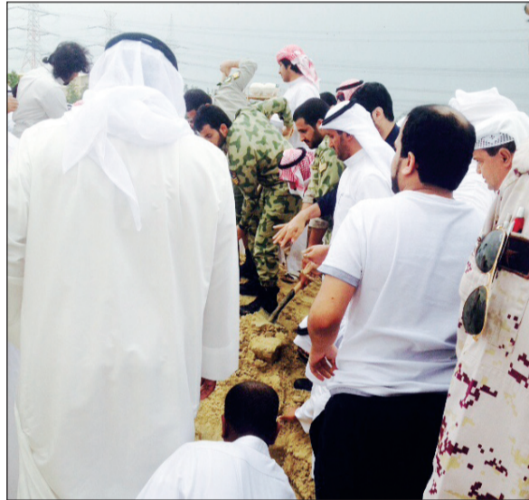
يهيئون على قبره التراب