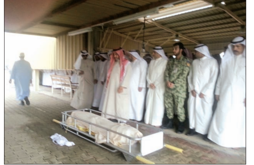
أثناء الصلاة على المتوفى

رسالة على «الواتساب» لكويتي إنسان انتشرت كالبرق على مواقع التواصل فشهدت جنازته حضوراً كبيراً