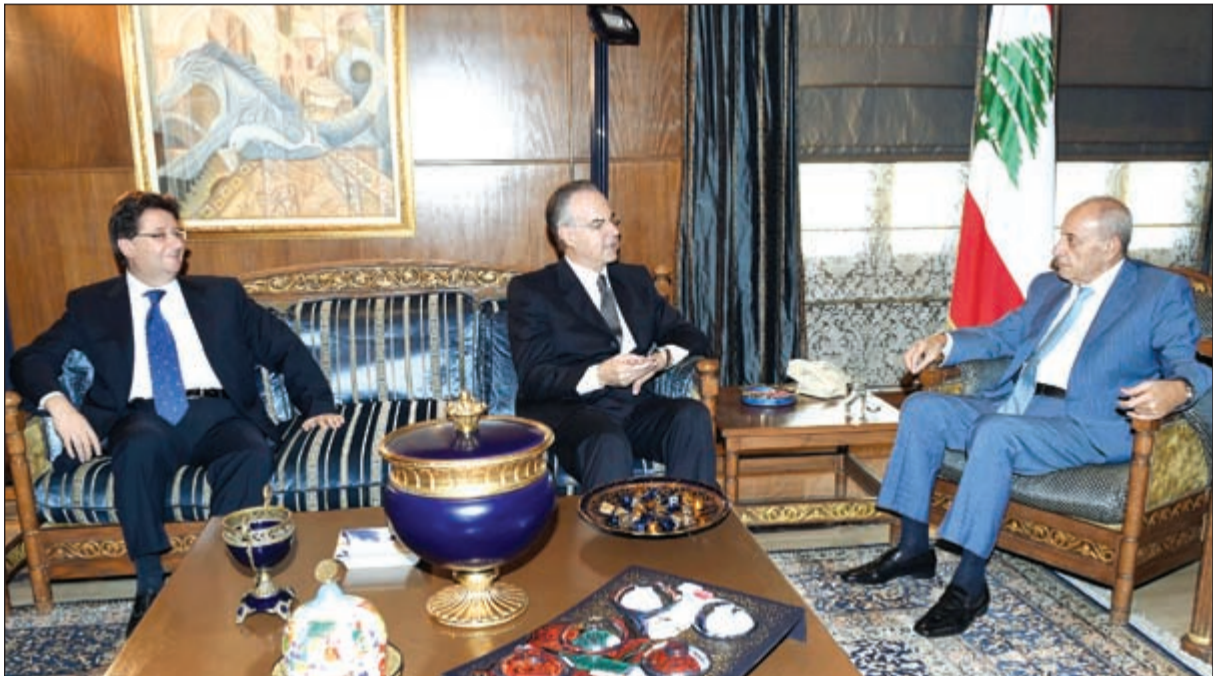
رئيس مجلس النواب نبيه بري مستقبلا النائبين جورج عدوان وإبراهيم كنعان في عين التينة

وينتظر رئيس المجلس عودة رئيس كتلة المستقبل فؤاد السنيورة من الخارج اليوم ليشرك في الاتصالات ومحاولات الاقناع، كما تأمل اوساطه ان يعود الرئيس تمام سلام من المؤتمر العربي - الاميركي اللاتيني في الرياض اليوم بعد ان يكون التقى رئيس تيار المستقبل سعد الحريري. وكان امس كلام بهذا الموضوع للعماد عون، انما والتقى الجميل امس لمحلم الرياشي موقفا من د.سمير جعجع.