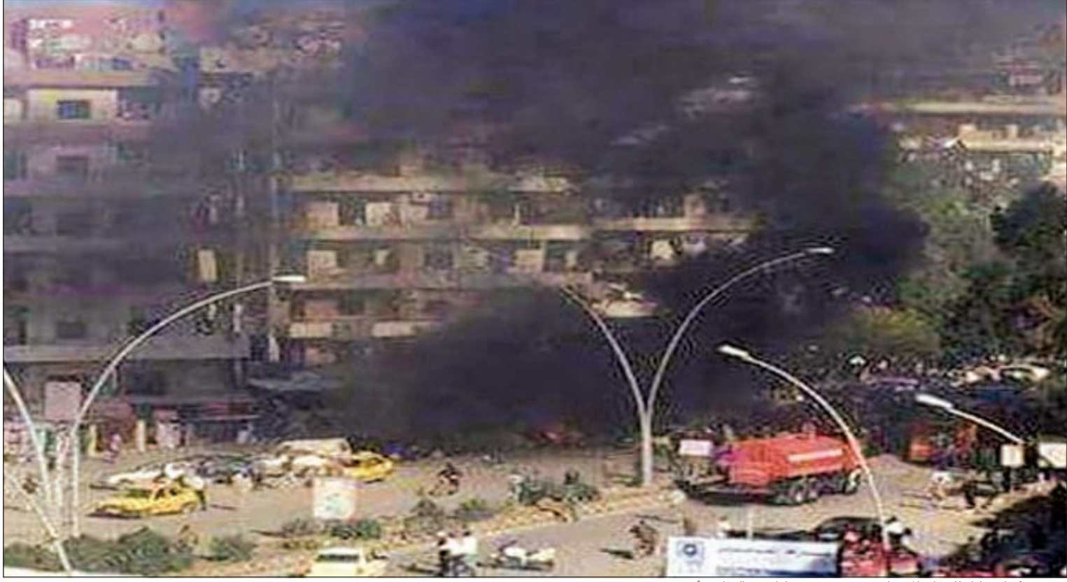
صورة بثتها «سانا» للدخان المتصاعد من موقع سقوط إحدى القذائف أمس

عواصم - وكالات: اعتبرت وزيرة سلاح الجو الأميركي ديبورا لي جيمس أن الغارات الجوية التي ينفذها الائتلاف الدولي الذي تقوده بلاده «تضعف» تنظيم داعش، لكن الحملة تتطلب وجود «قوات على الأرض» للقضاء عليه. وقالت الوزيرة للصحافيين في اليوم الثالث من معرض دبي للطيران أمس «تقييمي هو أننا نحقق تقدماً في استراتيجية إضعاف، وصولاً في نهاية المطاف إلى القضاء على تنظيم الدولة الإسلامية».