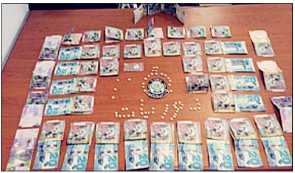
المواد المخدرة التي تم ضبطها