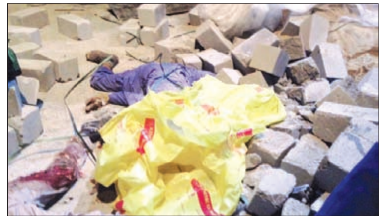
جثة الهندي تحت الطابوق