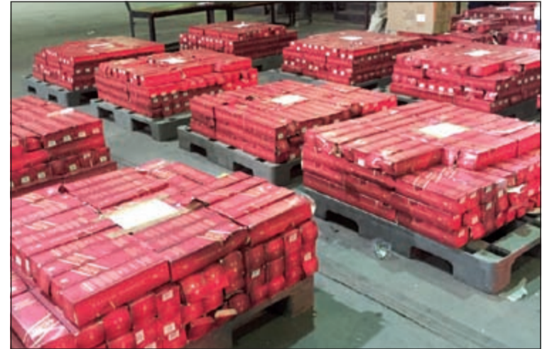
الخمور بعد حصرها في ميناء الشويخ