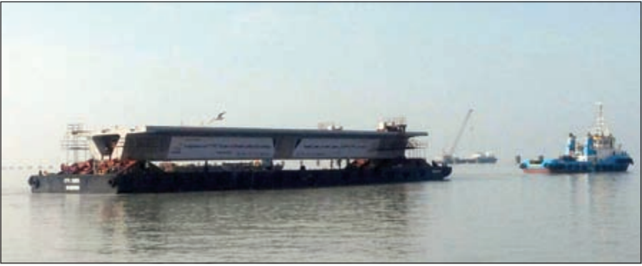
أول قطعة خرسانية في الجزء البحري من الجسر