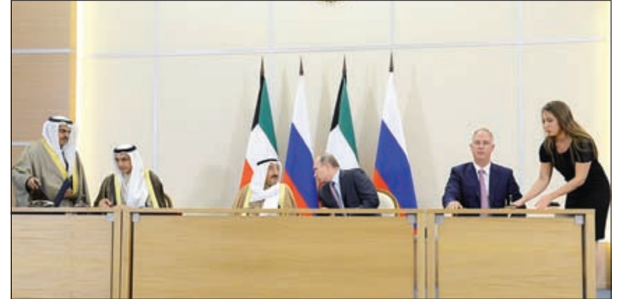
صاحب السمو الأمير الشيخ صباح الأحمد والرئيس بوتين يشهدان توقيع مذكرة تفاهم بين الهيئة العامة للاستثمار والصندوق الروسي للاستثمار المباشر بشأن برنامج الاستثمار المشترك

وليبيا. وقد أكد ممثل صاحب السمو الأمير الشيخ صباح الأحمد، سمو رئيس مجلس الوزراء الشيخ جابر المبارك، أن القمة تكتسب أهمية كبيرة في ظل المستجدات والمتغيرات التي يشهدها العالم في الوقت الراهن. وأعرب عن ثقته الكبيرة في نجاحها لحرص المملكة العربية السعودية بقيادة خادم الحرمين على توفير كل المقومات لتحقيق أهدافها وتعزيز التعاون بين الجانبين في مختلف المجالات. الرياض-وكالات: التامت في الرياض أمس القمة الرابعة للدول العربية ودول أميركا الجنوبية برئاسة خادم الحرمين الشريفين الملك سلمان بن عبدالعزيز وحضور 33 من رؤساء وملوك وزعماء العالم العربي وأميركا اللاتينية. وتشكل القمة فرصة لبحث التعاون بين دول ذات قدرات اقتصادية وإزنة على الصعيد العالمي، لاسيما في مجال النفط. كما تركز القمة على جملة من القضايا السياسية لاسيما الفلسطينية والتطورات في سورية