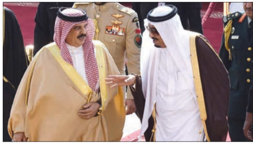
خادم الحرمين الملك سلمان بن عبد العزيز مستقبلاً عامل البحرين الملك حمد بن عيسى آل خليفة

وليبيا. وقد أكد ممثل صاحب السمو الأمير الشيخ صباح الأحمد، سمو رئيس مجلس الوزراء الشيخ جابر المبارك، أن القمة تكتسب أهمية كبيرة في ظل المستجدات والمتغيرات التي يشهدها العالم في الوقت الراهن. وأعرب عن ثقته الكبيرة في نجاحها لحرص المملكة العربية السعودية بقيادة خادم الحرمين على توفير كل المقومات لتحقيق أهدافها وتعزيز التعاون بين الجانبين في مختلف المجالات. الرياض-وكالات: التامت في الرياض أمس القمة الرابعة للدول العربية ودول أميركا الجنوبية برئاسة خادم الحرمين الشريفين الملك سلمان بن عبدالعزيز وحضور 33 من رؤساء وملوك وزعماء العالم العربي وأميركا اللاتينية. وتشكل القمة فرصة لبحث التعاون بين دول ذات قدرات اقتصادية وإزنة على الصعيد العالمي، لاسيما في مجال النفط. كما تركز القمة على جملة من القضايا السياسية لاسيما الفلسطينية والتطورات في سورية