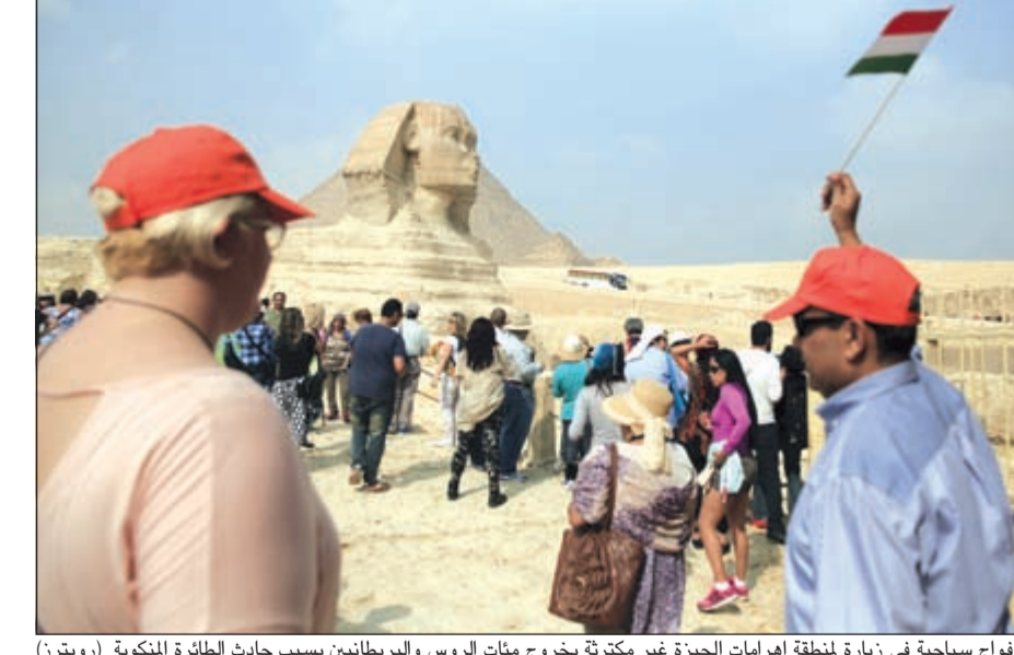
أفواج سياحية في زيارة لمنطقة اهرامات الجيزة غير مكتظة بخروج مئات الروس والبريطانيين بسبب حادث الطائرة المنكوبة (رويترز)

المتحدة ومصر وروسيا عن حادث سقوط الطائرة، يمكن أن تسفر عن مشاركة بعض خبراء «فبي»، وتحديدًا المتخصصين في القنابل، في التحقيقات لتقديم المساعدة، ويشارك في تحقيقات سقوط الطائرة الروسية حالياً مصر وروسيا وألمانيا وفرنسا وإيرلندا، ولا يوجد أي مشاركة من بريطانيا أو أميركا التي تفضل أيضاً معرفة سبب سقوطها بشكل غير مباشر ولكنهما لا يمتلكان أي دليل مادي لفحصه. بدوره صرح ديمتري بيسكوف المتحدث باسم الكرملين أمس بان لندن سلمت موسكو «معلومات معينة» بشأن الطائرة المنكوبة في سيناء. ونقلت وكالة «سبوتنيك» عنه القول «يمكن تأكيد أن معلومات استخباراتية معينة تم تسلمها من الجانب البريطاني». وأضاف للمصاحفين «لا أستطيع أن أخبركم بشأن نوعية المعلومات لأنني لست مطلعاً عليها. وبطبيعة الحال، فنحن نعمل على التعاون المشترك مع كل الدول التي يمكن أن تساعد في التحقيق في هذه المسألة الراهية». وكان المتحدث باسم الخارجية البريطانية قال لـ«سبوتنيك» إن بلاده سلمت موسكو استنتاجات المبنى على معلومات استخباراتية بأنه من المرجح أن الطائرة سقطت نتيجة «عمل إرهابي».