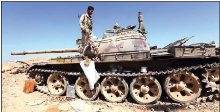
تدمير دبابة تابعة للحوثيين في تعز

الرياض - د.ب.أ: نفى المتحدث باسم قوات التحالف العربي، العميد الركن أحمد عسيري، صحة ما يتردد من أن قوات التحالف تأخرت في تحرير محافظة تعز اليمنية، مؤكداً «أنجزنا ما فشل فيه الناو». وقال في تصريحات خاصة لصحيفة «الوطن» السعودية نشرتها أمس إن العمل العسكري يخضع لمتغيرات كثيرة، واعتبر أن التحالف حقق في اليمن نجاحات لم يحققها دول تزيد على العشرين دولة مجتمعة، وقال «مثلا القوات الأمريكية وحلف الناو المكون من 28 دولة مكثت في أفغانستان 11 عاما ولم تحقق ما حققه التحالف في 7 أشهر». وأضاف: «لا يوجد تأخير في العمل العسكري، لأن مصطلح التأخير مرتبط بموعدها ونحن في التحالف لم نعلن عن وقت معين لإنهاء تحرير تعز، وأما ما يخص ترديد مصطلح قريبا التي تتكرر في حديث التحالف فهي لمخاطبة العقل العسكري الذي يعرف تفاصيل العمليات العسكرية، لأننا لا نمارس مباراة كرة قدم تنتهي خلال 90 دقيقة». وتابع «العمل العسكري هو عمل منظم تراتبي، وهناك مؤثرات كثيرة تؤثر فيه، منها الطبيعة والأرض والطقس وقوات العدو، وكل هذه الأشياء لها تأثير على مسار أي عمل عسكري، والأمر الآخر أن كل عملية لها جدول زمني سري لدينا، ولا يتم إعلانه لأن ذلك يعطي العدو فرصة وقيمة فيما يقوم به». من جهة أخرى، وصلت تعزيرات من القوات السودانية قوامها أكثر من 400 جندي إلى مدينة عدن لدعم القوات الموالية للرئيس عبد ربه منصور هادي، في مواجهة المتمردين الحوثيين الذين استعادوا مؤخرا مواقع في جنوب البلاد،