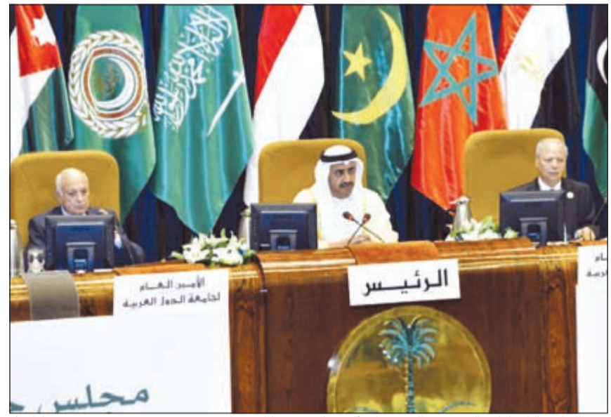
وزير الخارجية الإماراتي الشيخ عبدالله بن زايد آل نهيان مترفسا الاجتماع

الرياض - أ.ش.أ: عقد أمس في العاصمة السعودية الرياض أعمال الاجتماع الطارئ لوزراء الخارجية العرب برئاسة وزير خارجية الإمارات عبد الله بن زايد آل نهيان ومشاركة د.نبيل العربي أمين عام جامعة الدول العربية وذلك بناء على مقترح من الشيخ عبدالله بن زايد لبحث الخطوات التي يجب اتخاذها في مواجهة الانتهاكات الإسرائيلية ضد الشعب الفلسطيني والتي ترقى إلى جرائم حرب ولا تتسقط بالتقادم. وأكد وزير الخارجية الإماراتي الشيخ عبدالله بن زايد آل نهيان على أن القضية الفلسطينية هي قضية العرب الأولى وأن استمرارها دون حل عادل يشكل الجاذب الأساس لسوى الإرهاب والتطرف بالمنطقة، كما تظل هذه القضية مفتاح أمن وسلم في المنطقة فهي أساس كل التوترات. وقال في كلمته الافتتاحية إن الاجتماع الطارئ يأتي بناء على التصعيد الخطير الذي تقوم به الحكومة الإسرائيلية، والمستوطنون والجماعات اليهودية المتطرفة والقوات الإسرائيلية في مدينة القدس المباركة حيث تقوم إسرائيل يوميا بإرتكاب أشنع الجرائم وتنتهك حرماات المسجد الأقصى المبارك، وجميع المقدسات الإسلامية والمسيحية دون وازع أو رادع إلى جانب ظل هذه الجرائم المستمرة التي ترتكب بهذه الصورة البشعة، ونرى أن تسوية الحكومة الإسرائيلية في