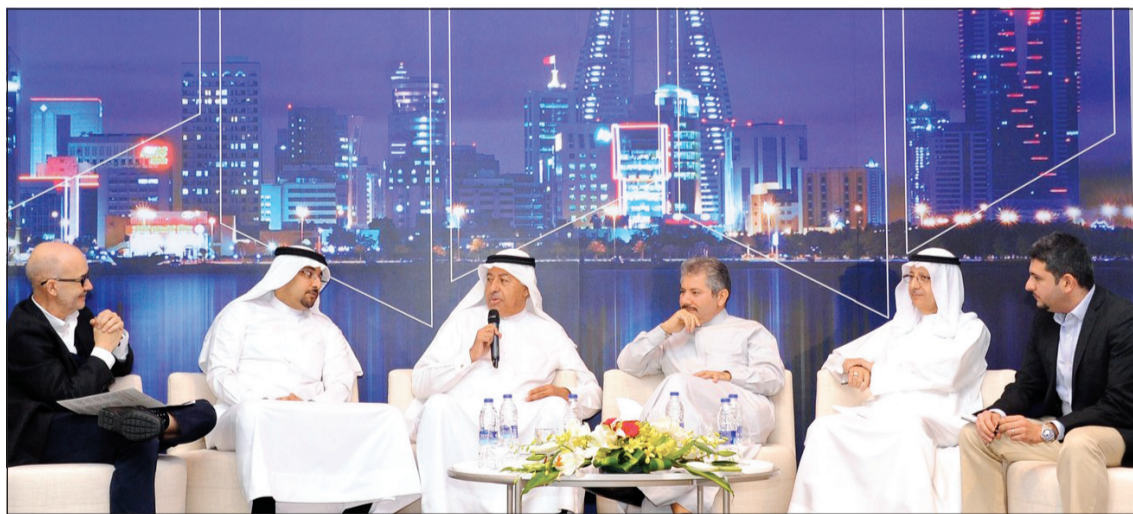
جانب من الجلسات

أحد الأعمدة الرئيسية في اقتصادات دول المنطقة، وتعد الحوكمة من أهم التحديات التي تواجهها الشركات العائلية.