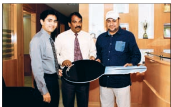
الفائز بسيارة يتسلم مفتاح السيارة الجديدة