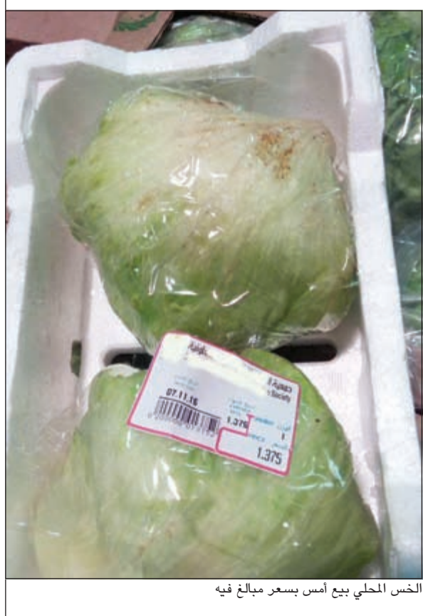
الخس المحلي بيع أمس بسعر مبالغ فيه

يتدارك هذا الخطأ بشكل فوري بعد مراجعة الأسعار مرة أخرى.