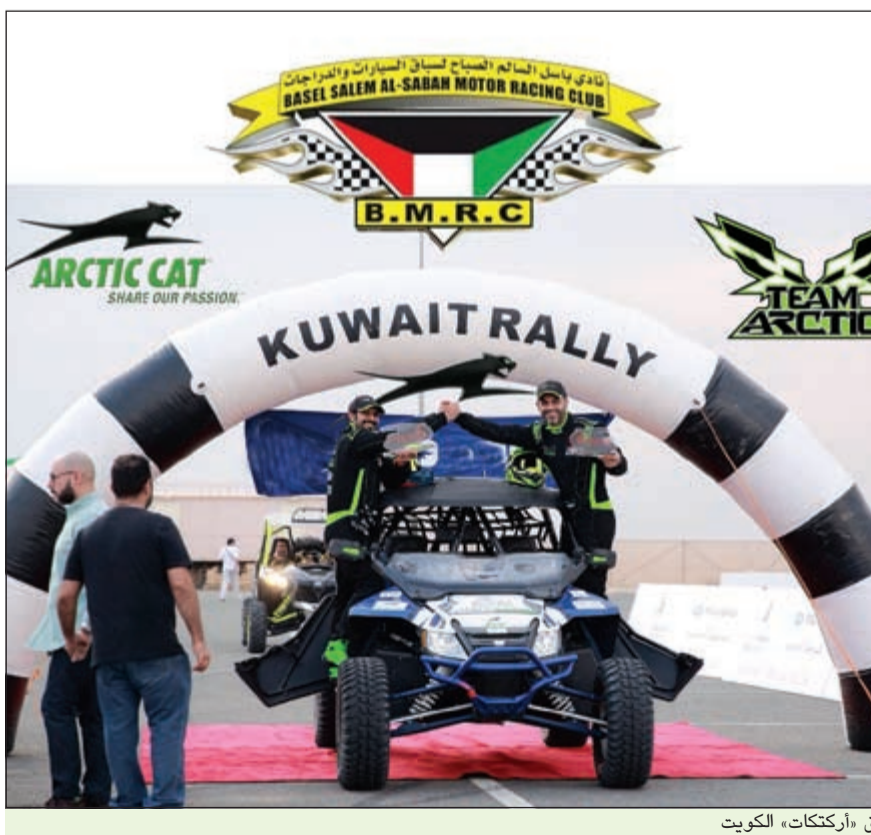
فريق «أركتكات»، الكويت