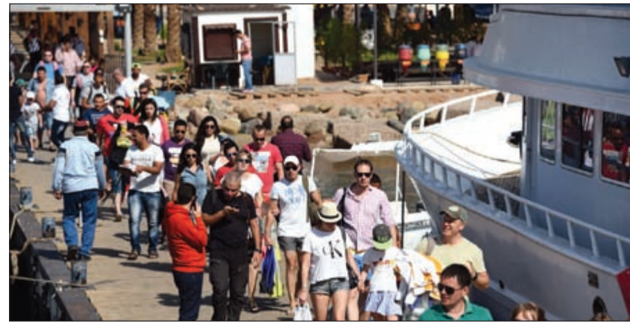
أجواء شبه طبيعية في شرم الشيخ باستمرار مئات السياح في قضاء عطلةهم السياحية (أ.ف.ب)

عواصم - وكالات: اتفق الرئيس المصري عبدالفتاح السيسي مع نظيره الروسي فلاديمير بوتين على تعزيز التعاون والتنسيق بين البلدين في مجال أمن الطيران المدني، وذلك إثر قرار بوتين تعليق الرحلات الجوية الروسية إلى مصر بعد تحطم طائرة روسية في سيناء، وخلال مكالمات هاتفية جرت بمبادرة من السيسي، «تم الاتفاق على استئناف رحلات الطيران الروسية إلى مصر في أقرب وقت ممكن». بدوره، أصدر «الكرملين» بياناً عن فحوى المحادثة الهاتفية بين بوتين والسيسي ذكر فيه أن الرئيسين «شددوا على أن هذه الخطوات ترمي إلى تحسين الفاعلية الكاملة للإجراءات الأمنية المتخذة