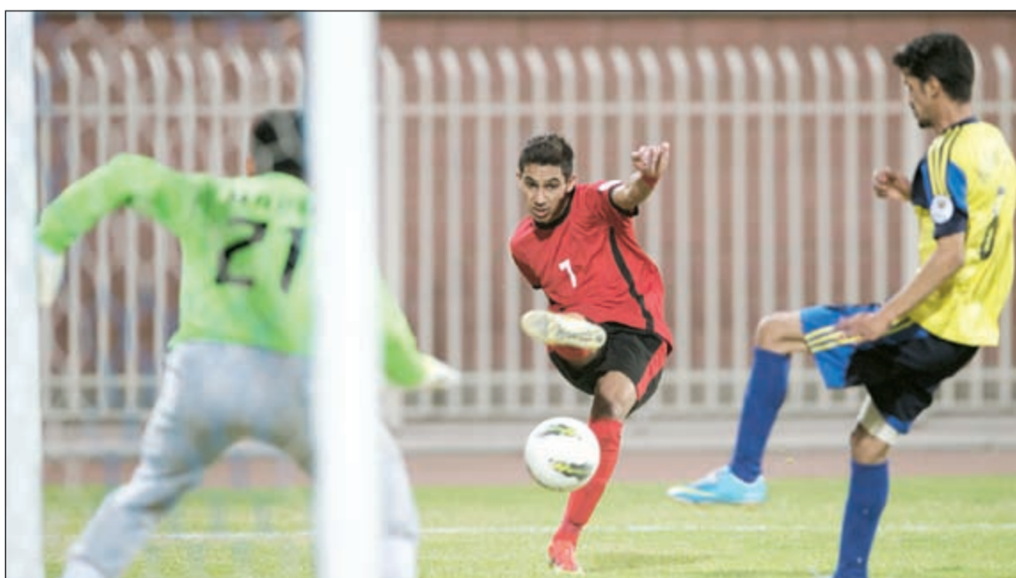
الساحل وخيطان يبحثن عن تحقيق أول 3 نقاط