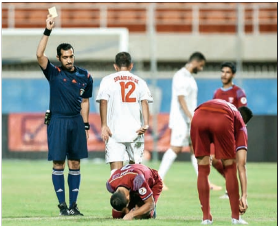
النصر لم ينجح في الثأر من الصليبيخات الذي أخرجه من بطولة ولي العهد

لوقت أكبر لكي يحقق النتائج الإيجابية ويتمكن من مقارعة الفرق الكبيرة، كما أن نقص اللياقة البدنية يعود إلى أن الموسم مازال في بدايته وجميع الأندية تعاني من هذه النقطة وسنعمل في الأيام المقبلة على تلافي مثل هذه الأمور كي لا تعود بالسلب على المستوى العام.