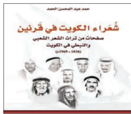
كتاب «شعراء الكويت في قرنين»