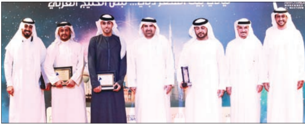
جمال بن حويرب العضو المنتدب مؤسسة محمد بن راشد آل مكتوم مكرماً للشعراء