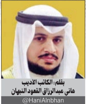
بقلم: الكاتب الأدبي هاني عبدالرزاق النعود النيهان @HaniAlnabhan

جعلت القلب يستشعر جيدا مدى النعمة التي يعيش بها!