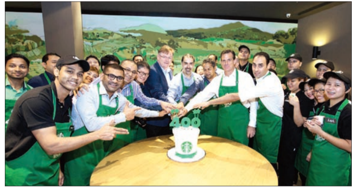
جانب من احتفال فريق ستاربكس بافتتاح المقهى رقم 400

احتفلت ستاربكس، سلسلة المقاهي العالمية الرائدة في صناعة القهوة، بافتتاح المقهى رقم 400 في منطقة الشرق الأوسط وشمال أفريقيا. ويقع المقهى الأحدث لستاربكس في التوسعة الجديدة في مول الإمارات، لشهد بذلك على استمرار إستراتيجية الشركة في نشر مقاهيها لتكون دائماً الأقرب لزيائنها والمجتمعات التي تخدمها.