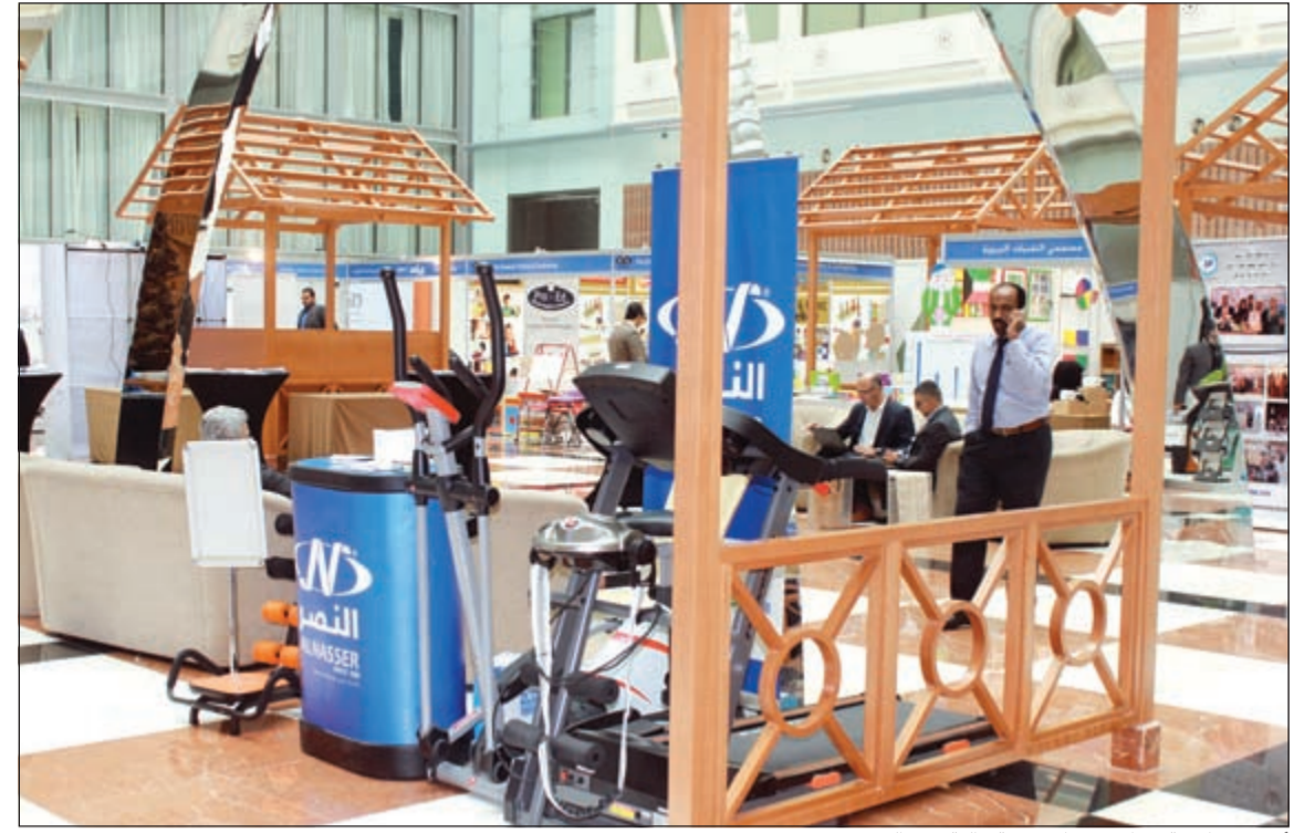
أجهزة رياضية متطورة وذات تقنية عالية من «النصر»

برعاية شركة النصر ومؤتمر ومعرض تكنولوجيا التعليم (إيديوتك) تحت رعاية وزير التربية ووزير التعليم العالي د.بدر العيسى، وذلك خلال الفترة من 27 - 28 أكتوبر 2015 في فندق كراون بلازا، بحيث يهدف المعرض والمؤتمر إلى التخطيط والبناء والتصميم، تجهيز المرافق الترفيهية، صالات الألعاب البدنية، والتقنيات التعليمية والفصول الذكية. وتأتي مشاركة النصر ضمن حرص الشركة الدائم على دعم مختلف الأنشطة التي تعنى بنشر الوعي التعليمي والرياضي بين جميع فئات المجتمع من أجل أجيال تتمتع بصحة أفضل وإدراك متزايد بالدور الذي يمكن أن تساهم به الرياضة في توعية الأذهان بأحدث التقنيات التعليمية.