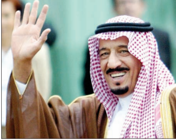
خادم الحرمين الشريفين الملك سلمان بن عبدالعزيز آل سعود

قراره التدخل عسكرياً في سورية لدى نظام حليفه الرئيس بشار الاسد ساهم في تعزيز نفوذه على الساحة الدولية. اما المرتبة الثانية في التصنيف فقد احتلتها المستشار الألمانية التي تقدمت بذلك ثلاثة مراكز عن تصنيف العام السابق، في حين خسرت أوباما مركزاً واحداً ليترجع الى المرتبة الثالثة بعدها كان في العام السابق في المرتبة الثانية خلف بوتين. وبين الشخصيات التي انضمت حديثاً الى تصنيف فوربس المرشح لنيل بطاقة الترشح الجمهورية الى الانتخابات الرئاسية الاميركية دونالد ترامب الذي احتل المرتبة 72. اما زعيم تنظيم الدولة الاسلامية ابو بكر البغدادي الذي كان في العام 2014 أبرز الذين انضموا الى هذه القائمة فقد احتفظ بمكانته في التصنيف اذ لم يتراجع الا ثلاثة مراكز (المركز 57 مقابل 54 في 2014).